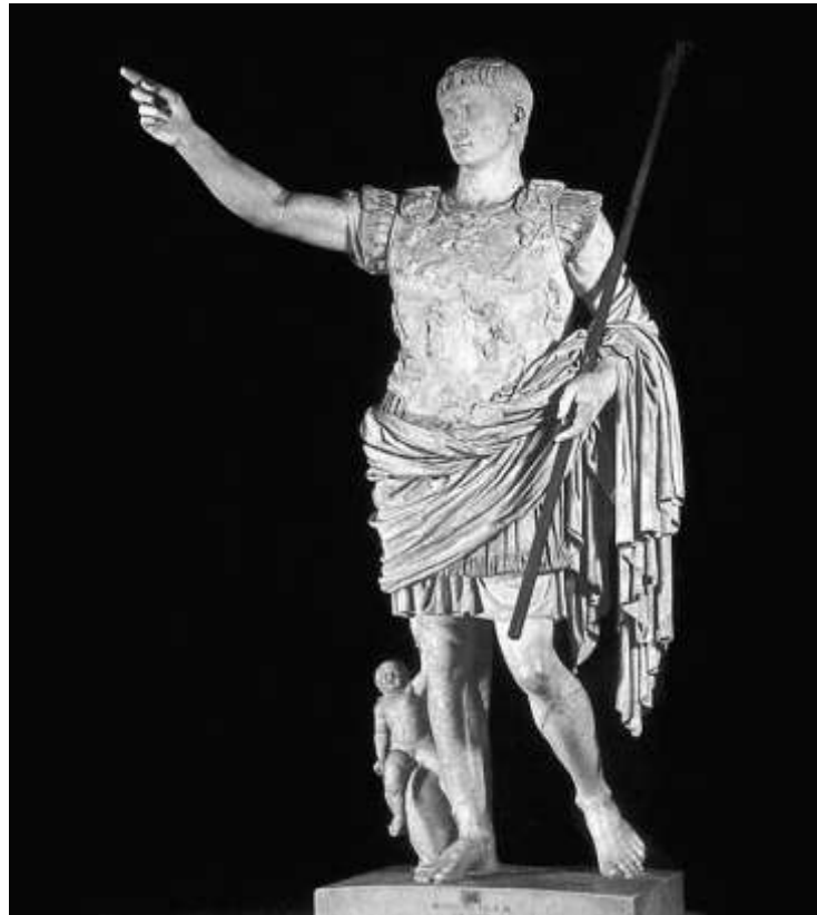
Fig.1. Estatua de Augusto (Prima Porta, Roma)

Cabe destacar, entre los primeros, toda una serie de sacerdotes procedentes de la Bética, a pesar de tratarse de una provincia que se hallaba bajo la jurisdicción del Senado 17 .