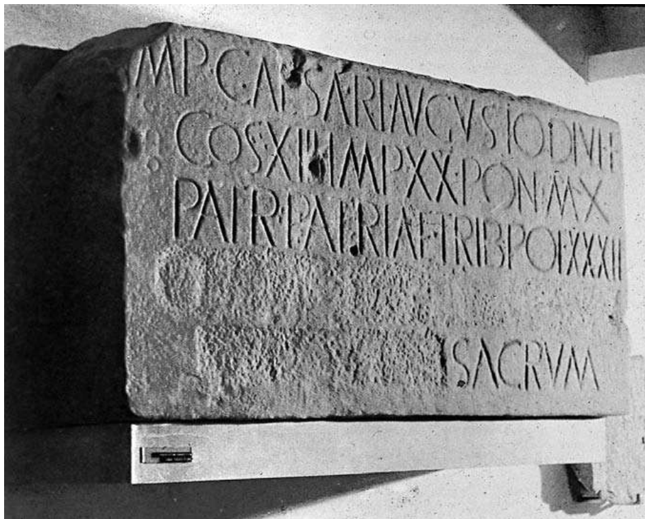
Fig.3. Altar dedicado a Augusto hallado en la Campa Torres (Gijón)

El monumento gijonés de la Campa Torres cumpliría, por tanto, una función similar al hallado en Astorga (de los lougei ), aunque parece circunscribirse a un ámbito geográfico más reducido, incluyéndose por consiguiente ambas áreas en el marco de unos cultos dirigidos desde la superestructura político-administrativa romana 60 .