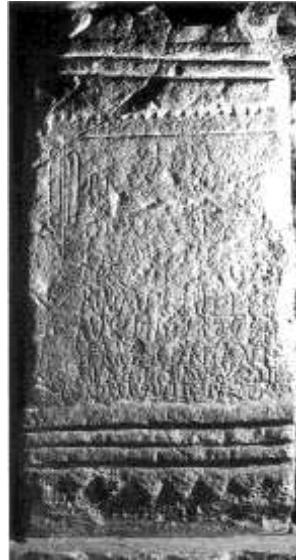
Fig.2. Muestra del culto imperial (Villalís de la Valduerna, León)

Los augustales , cuyo origen tendría lugar en una fase histórica anterior, acabarían por confundirse con los seviri augustales 44 .