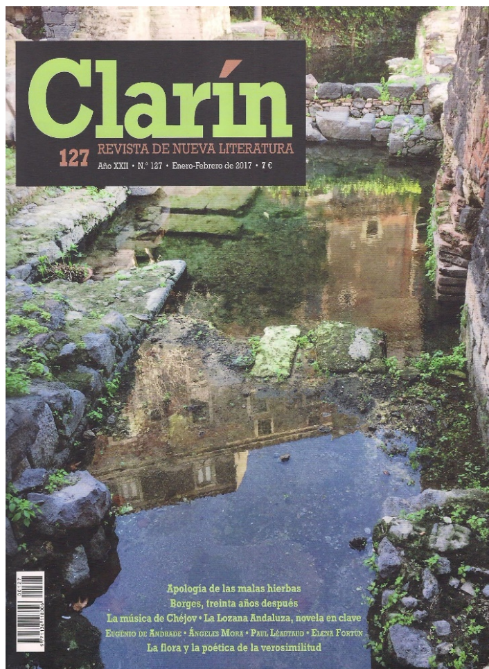
Fig. 9. “El río Amenano entre las ruinas del Teatro Griego (Catania)”, Clarín , 127, enero-febrero de 2017.