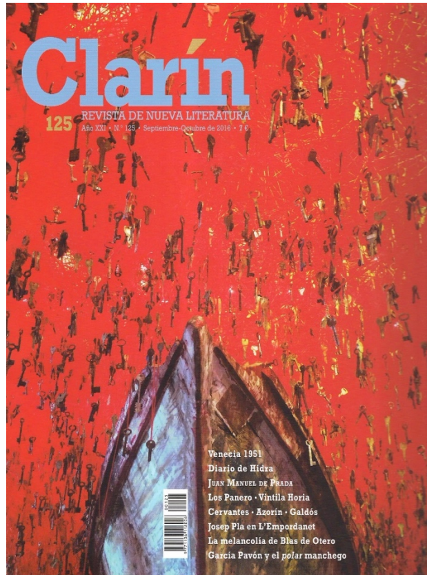
Fig. 14. “La nave de los sueños, Bienal de Venecia, 2015, pabellón japonés”, Clarín , 125, septiembre-octubre de 2016.