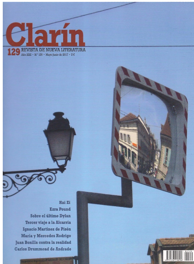
Figura 10. “El cielo de Carouge” (Ginebra), Clarín , 129, mayo-junio de 2017