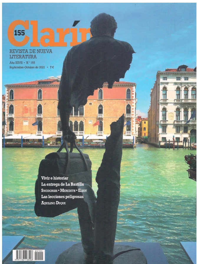
Fig. 4. “Invitación al viaje (Escultura de Bruno Catalano ante el Gran Canal)” (Venecia) ( Clarín , 155, septiembre-octubre de 2021)