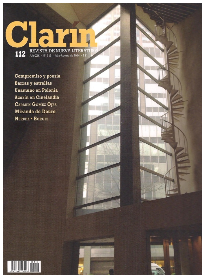
Fig. 7. “Por la secreta escala”. Escalera de caracol de la St. Peter’s Lutheran Church, junto al rascacielos Citigroup Center (antes llamado Citicorp Center), Clarín , 112, julio-agosto de 2014.