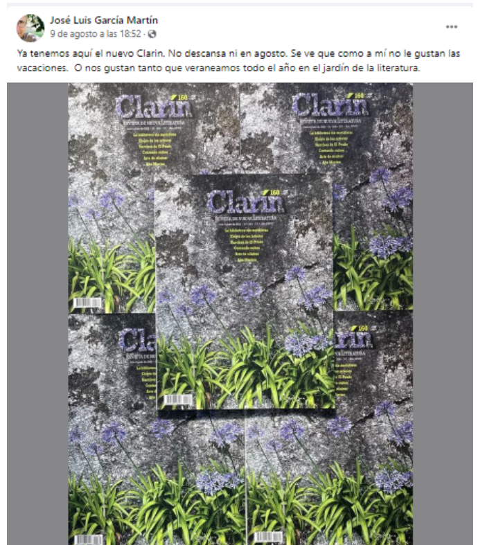
Fig. 2 y 3. José Luis García Martín (2022, 27 de julio y 9 de agosto). Publicaciones en Facebook.