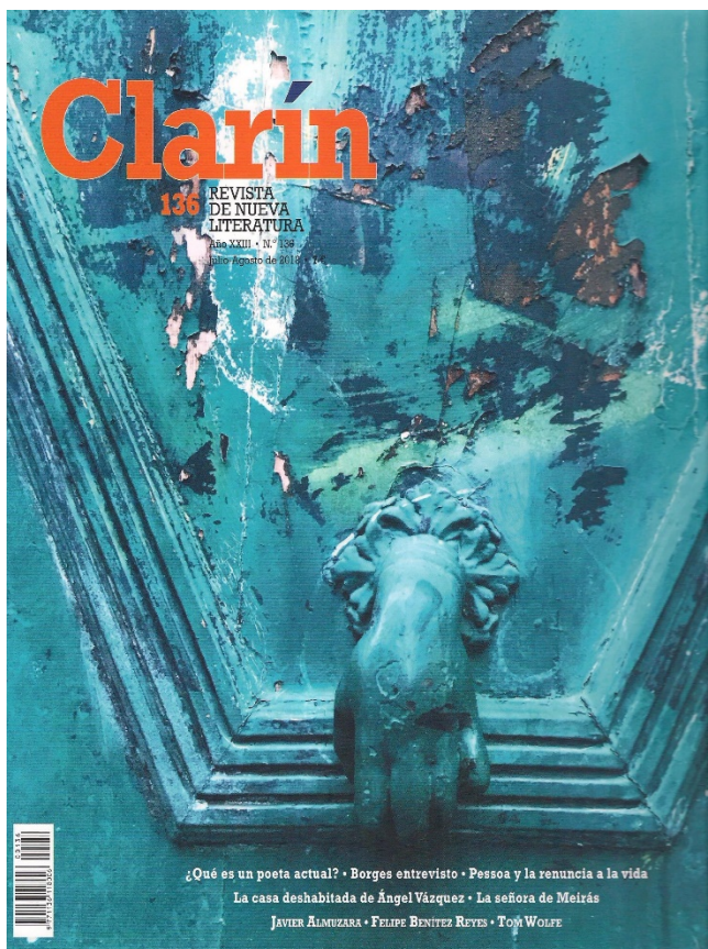
Figura 12. “Aldaba en Toulouse”, Clarín , 136, julio-agosto de 2018