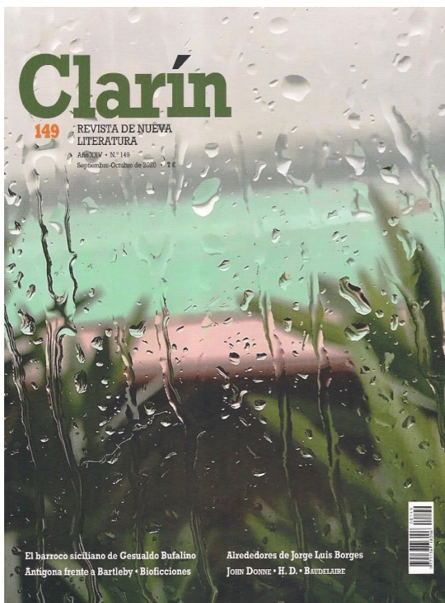
Figura 13. “Vista del Bósforo” (Estambul), Clarín , 149, septiembre-octubre de 2020