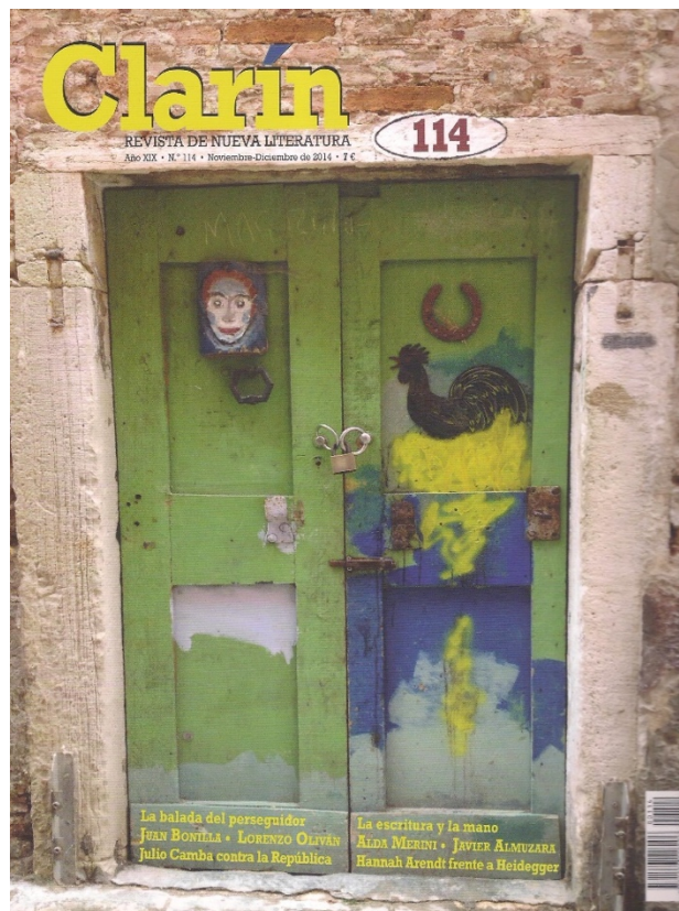
Fig. 15. Sin título, Clarín , 114, noviembre-diciembre de 2014.