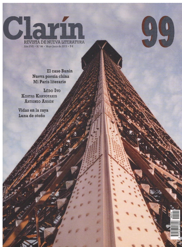
Figura 11. “Torre Eiffel”, Clarín , 99, mayo-junio de 2012.