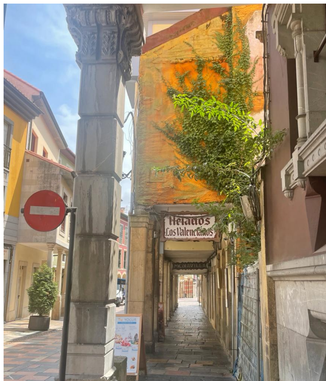
Figs. 16 y 17. “Sin título”. Calle Rivero (Avilés), Clarín , núm. 153, mayo-junio de 2021, y edificio del que fue tomado el detalle de la fotografía