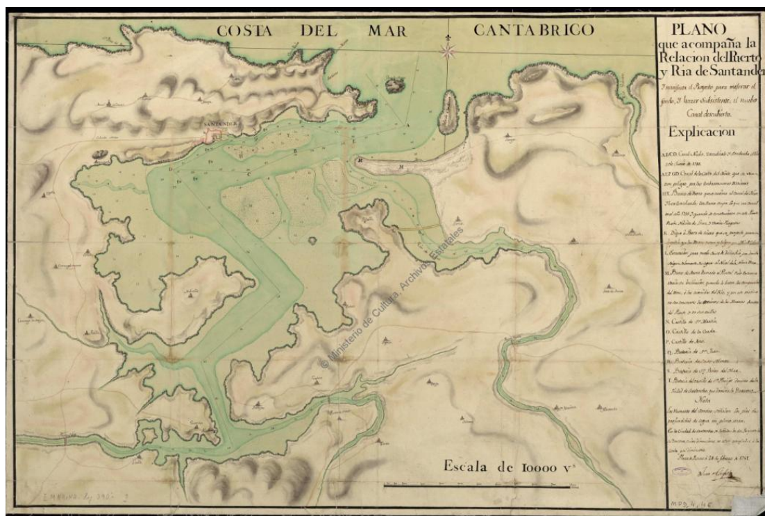
Figura 4. Puerto de Santander, 1781

Nota. http://www.mcu.es/ccbae/es/consulta/resultados_ocr.do .