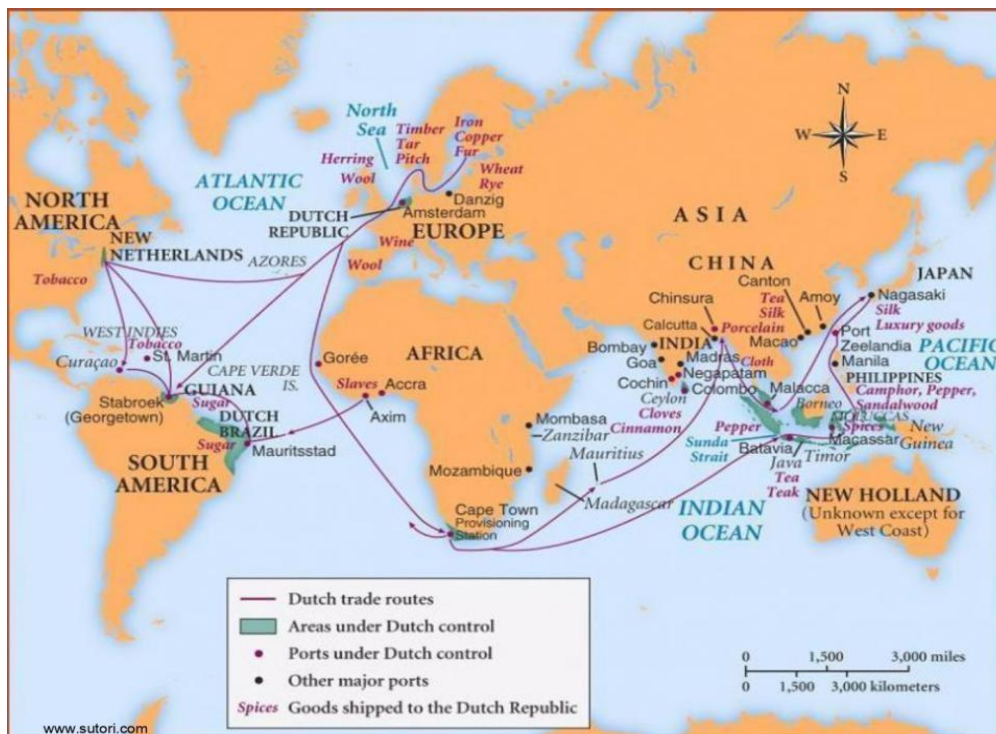
Figura 2. Rutas comerciales de la Compañía Neerlandesa de las Indias Orientales (V.O.C.)