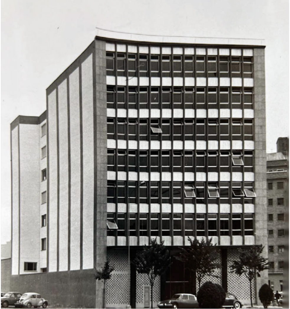
FIG. 8. Edificio para Colegios Profesionales de Asturias, popularmente Colegio de Médicos. h. 1968.