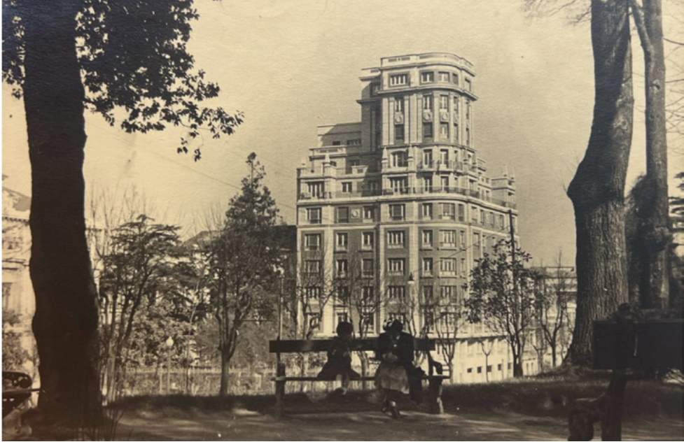
FIG. 5. Edificio Calle Conde Toreno, 5. Oviedo. h. 1950. Expediente 552.

tes de una casa: la zona de recibir, la zona íntima y la de servicio, que tendría su propio acceso y montacargas.