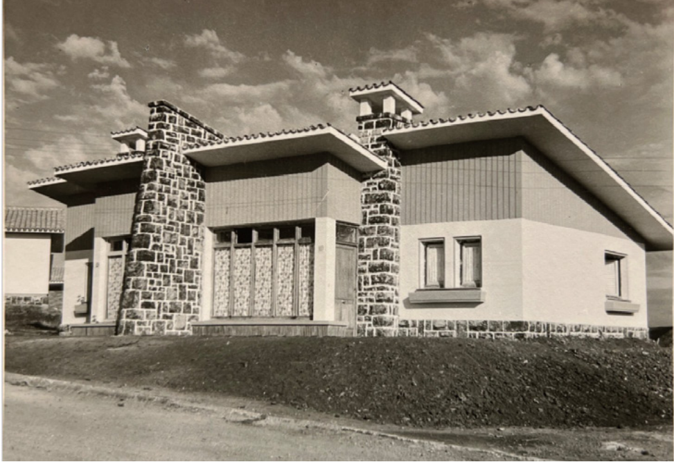
FIG. 4. Uno de los modelos de vivienda para Perlorá. Julio Galán y F. Cavanilles.