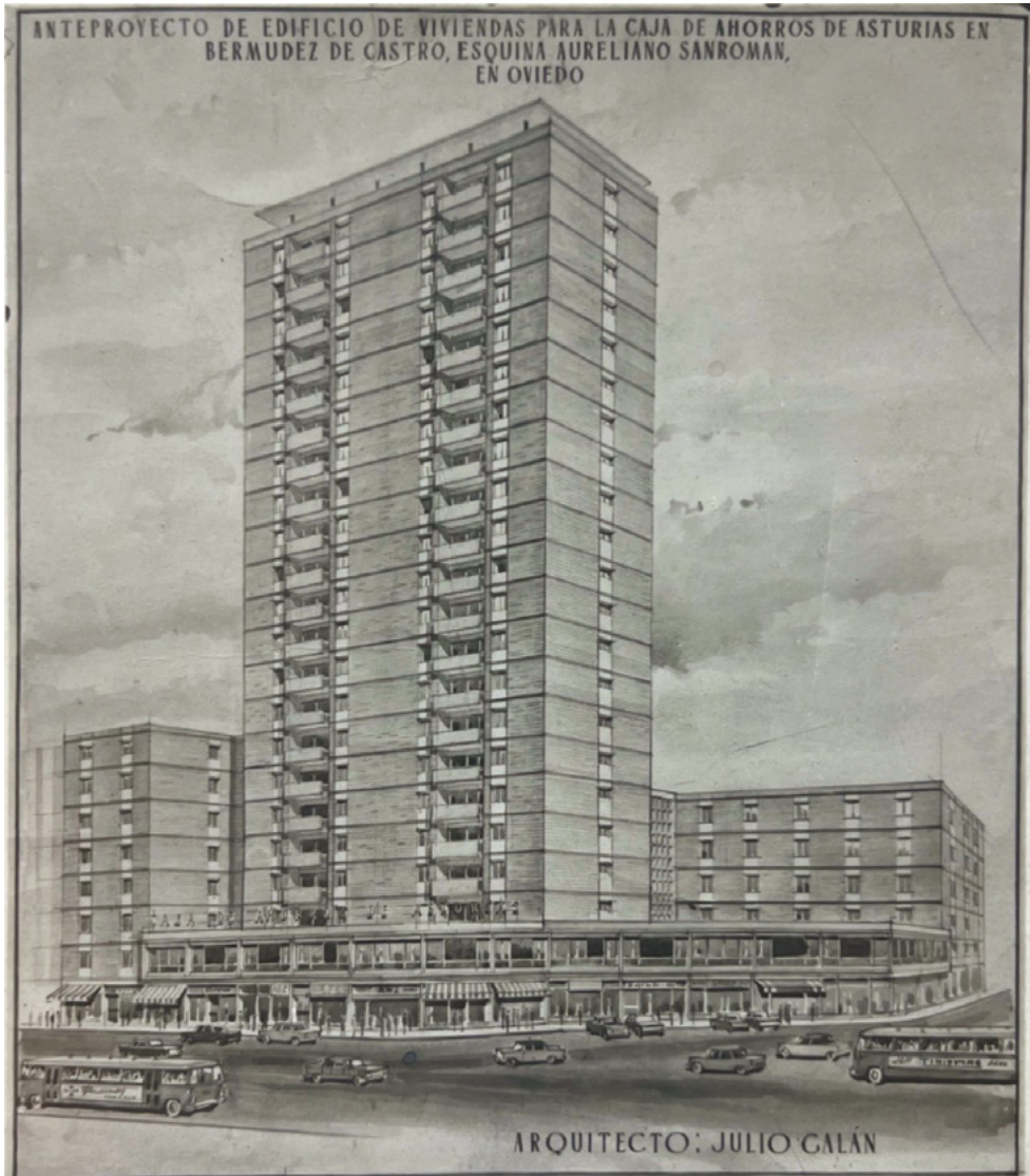
FIG. 7. Torre «Teatinos». Oviedo, 1964. Expediente 2971.

Cuesta en la calle Covadonga de Mieres, junto con una línea negra que enmarcan la el arranque de la terrazas, detalle significativo que también incorporará Saiz Heres en Oviedo en González del Valle o Castelo en Gijón y que Galán empleará como recursos habitual en sus obra de la década de los 60 y 70 en Sama de Langreo, por ejemplo, variando el color.