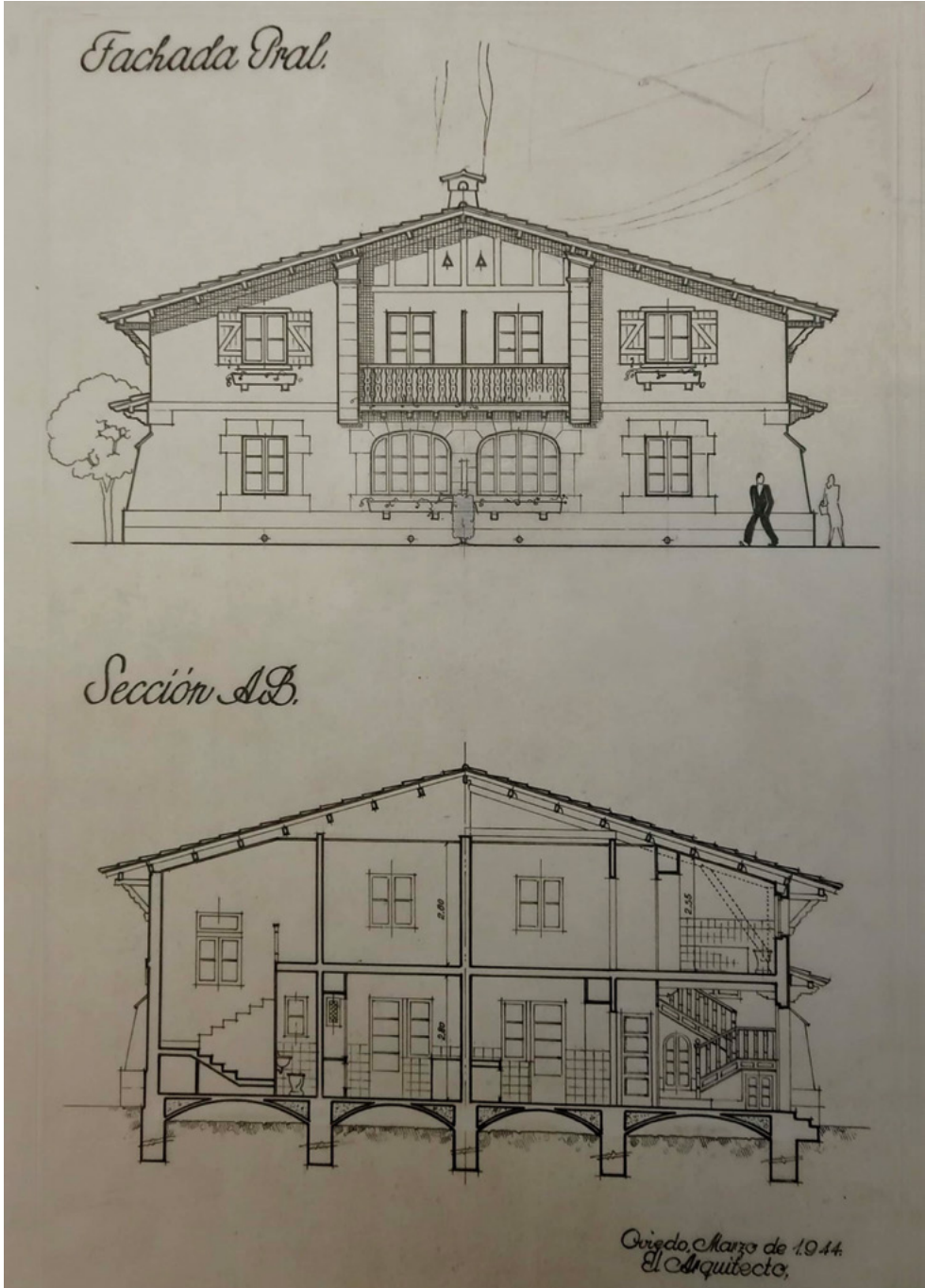
FIG. 1. Fachada principal y sección de un modelo de vivienda para el Grupo José Antonio en Siero. 1944. Expediente 257.