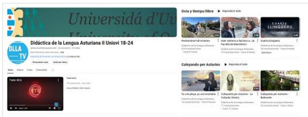
Figura 1. Página principal del Canal de YouTube de la asignatura.

Una vez finalizados y revisados los videos en todas sus dimensiones –lingüística, estilística y en cuanto a su adecuación para el ámbito educativo–, se compartirían con toda la comunidad en el Canal de YouTube de la asignatura (@didacticadelenguasturia56) (Figura 1). Para darles difusión, se emplearían la propia plataforma Didactictac-TV 6 y sus redes sociales, pero también las propias redes sociales profesionales y las de los estudiantes, que además lo compartirían con familiares y amigos a través de mensajería instantánea.