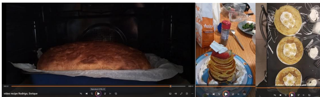
Figura 2. Ejemplos de vídeos generados por el alumnado sobre recetas de cocina

El tercer proyecto nos ha sido propuesto por el British Council. Participan todos los centros de España adscritos al Programa Bilingüe British Council, la valoración del jurado será en mayo, y deseamos que nuestros representantes tengan mucha suerte. Se trata de participar en el concurso Read It , creando vídeos breves recomendando un libro que les haya gustado. En este caso, la dificultad surge de la necesidad de ajustarse a las bases, plazos y criterios de evaluación del concurso (Figura 3).