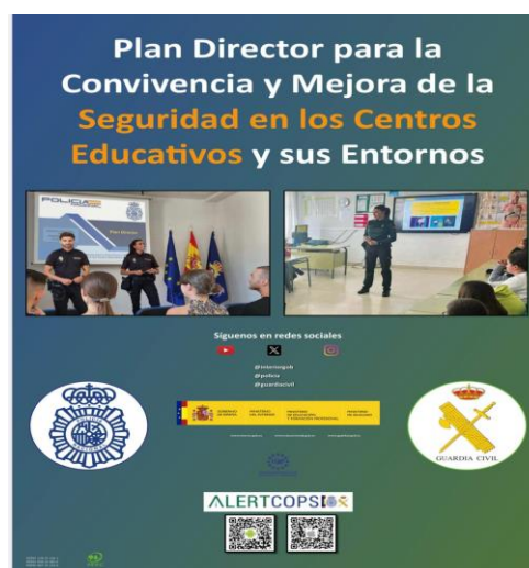
Imagen 2. Plan Director para la convivencia y mejora de la seguridad en centros educativos y sus entornos