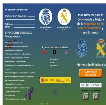
Imagen 3. Tríptico de la Comunidad Educativa