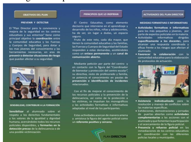
Imagen 4. Tríptico de la Comunidad Educativa