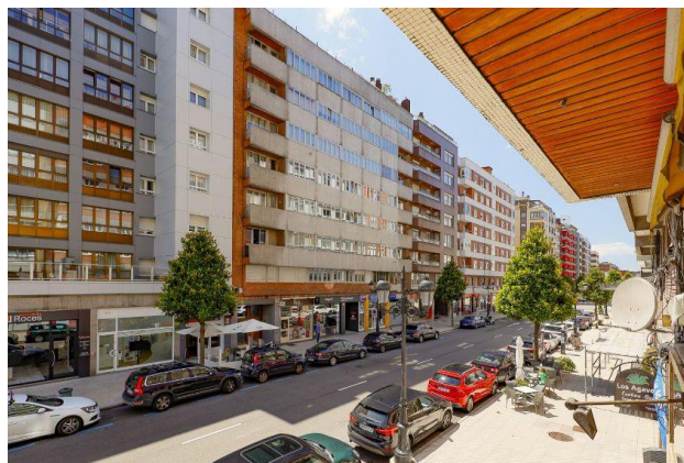
Imagen 5. Avenida Valentín Masip

Según la nota prensa de La Nueva España, escrita por Orihuela, “Del fin del mundo al centro de Oviedo”, fue el lugar elegido para los primeros que emprendieron el éxodo desde el centro. Cuando la ley de la oferta y la demanda impuso que sin dinero y sin apellido no se podía vivir en Cervantes o la Plaza de América, las familias de siempre se trasladaron a Valentín Masip y Colón. La zona en la que se encuentra el centro es un barrio, denominado, La Ería, con un alto índice de inmigración debido a que era una zona barata, lo que generó el asentamiento de colectivos de inmigrantes procedentes en su mayoría de Sudamérica, los cuales aportan un número significativo de alumnado al centro. A continuación, en la imagen 5, podemos ver una de las calles de la Avenida Valentín Masip.