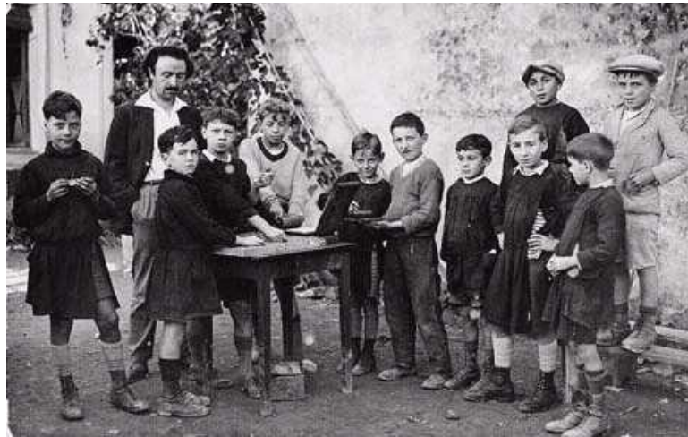
Ilustración 5 Imagen en la escuela rural, Bar-sur-Loup, Francia.

Nació en Gars, una pequeña localidad del sur de Francia en el año 1896 y falleció a la edad de setenta años en el año 1966. En 1920 se convirtió en maestro y desarrolló sus ideas pedagógicas a la vez que desarrollaba una escuela rural en Bar-sur-Loup, en Francia.