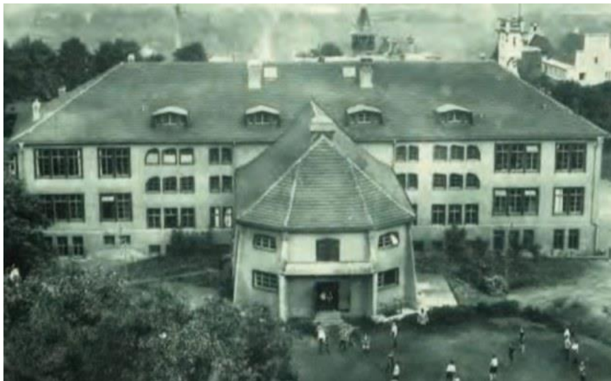
Ilustración 3 Primera escuela Waldorf, Stuttgart, Alemania.

La primera escuela Waldorf se fundó en 1919 en Stuttgart, Alemania 11 en la cual se trabajaban los principios pedagógicos Waldorf basándose en su desarrollo integral, enfoque artístico y holístico de la educación.