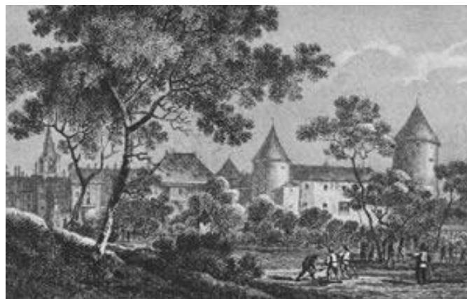
Ilustración 1 Granja experimental en Neuuhof, Alemania.

Posteriormente, en 1805 fundó el internado de Yverdon en Suiza, este se pasó a convertirse en un centro muy importante para la difusión de las ideas de Pestalozzi ya que comenzaron a venir estudiantes y educadores de toda Europa a conocerlo.