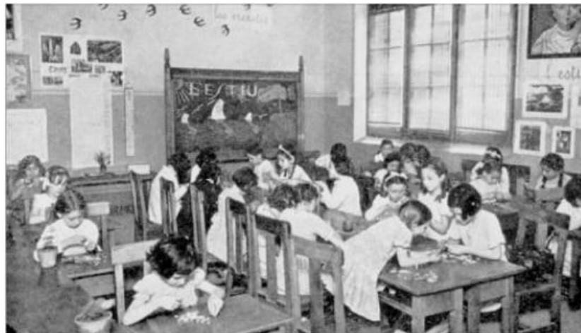
Ilustración 6 Escuela Decroly, Bruselas.