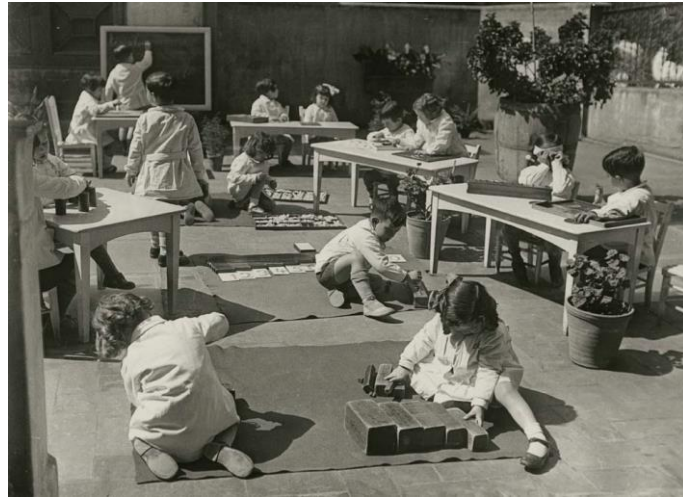
Ilustración 4 Ejemplo de un aula Montessori.