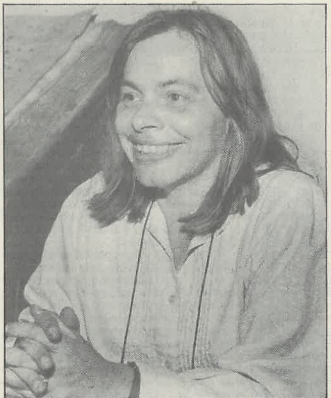
Cristina Peri Rossi visita de nuevo Salamanca para intervenir en el Curso Superior de Filología Hispánica.