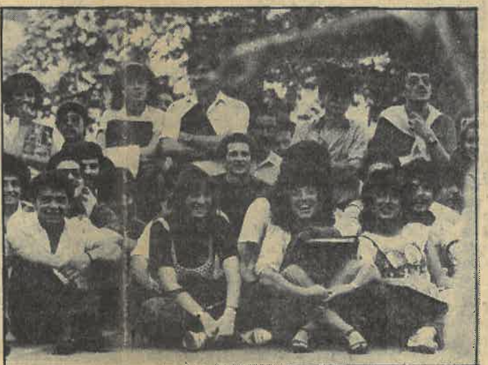
La juventud reunida tratará los problemas que enfrenta tras ocho años de régimen militar.

El encuentro, organizado por el Comité Nacional para el Año Internacional de la Juventud, comenzará el próximo jueves en la Ciudad Universitaria.