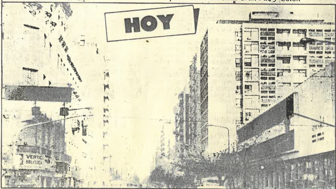
La misma esquina en la actualidad: "¡El tiempo pasa!..."

sirve con eficacia en esta tarea de acercamiento a ese pasado inmediato y creemos que CORDOBA puede exhibir con gene-