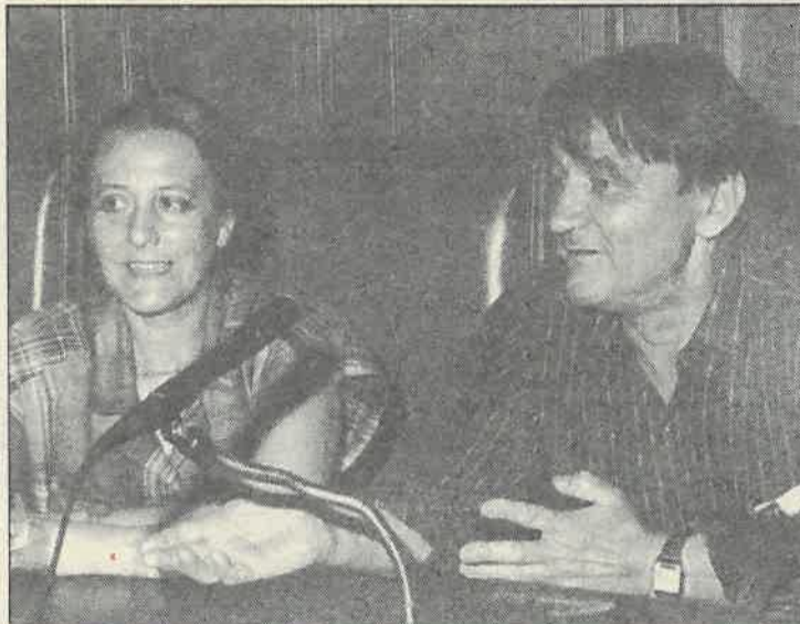
«El exilio es algo irreversible», según el autor de «Navíos y borrascas».

Por el contrario, Daniel Moyano pertenece a un grupo de escritores del interior de Argentina que practican una lite-