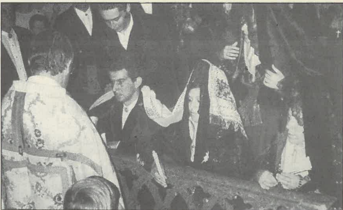
Las parejas salmantinas se siguen casando por la iglesia.

Mientras que en el Registro Civil se incoaron, en 1988, 167 expedientes, en el Obispado 415.