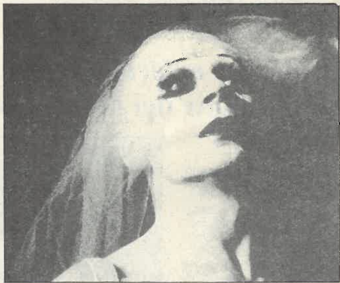
Lindsay Kemp Company.