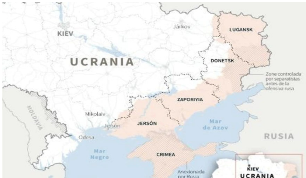
Mapa 3: Situación de la ocupación rusa del sudeste de Ucrania tras la contraofensiva ucraniana sobre Járkov.