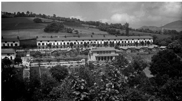
Alarde, «Vista de la vivienda adosada de obreros y vía del tren», Lieres, 1960, Muséu del Pueblu d'Asturies.

ejercicio de control sobre la vida privada de los vecinos aplicado por el segundo marqués de Comillas fue de los más férreos de todo el periodo 164 . Y, para el conocimiento del fenómeno a modo general, los trabajos de José Sierra Álvarez —citados con anterioridad— abordan de manera profunda toda la literatura de la época contra la taberna procedente de ingenieros industriales, reformadores sociales e higienistas 165 .