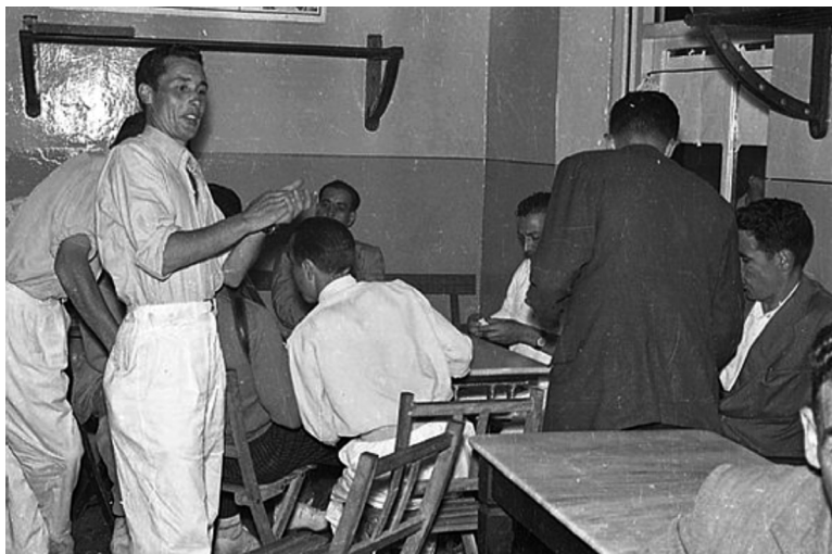
José Muñiz Suárez, «Partida de Cartas en el Chigre», Turón, 1957, Fondos Fotográficos del Muséu del Pueblu d'Asturias.

y un 48,9 por cien iban al bar a «ver la tele». Pero, las cifras más altas eran las de los mineros y los obreros, un 65,1% de los primeros veían la «tele» en el bar y un 60,3% los segundos, verificándose que esta actividad de distracción o entretenimiento también tenía un claro sentido colectivo 49 .