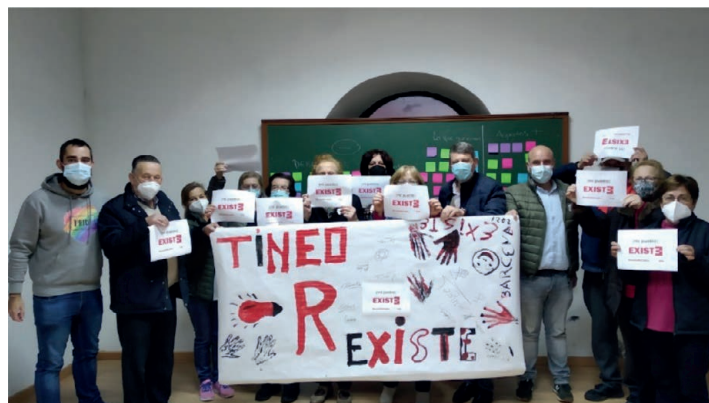
Imagen 2. Asistentes al taller participativo de Bárcena del Monasterio.

Con motivo de la “XXI Semana de la Ciencia” de la Universidad de Oviedo se implementaron (testeo, evaluación) las propuestas planteadas. Nuestro objetivo: dignificar a la ciudadanía (rural) partiendo de las necesidades comunitarias. Frente a la #EspañaVacía debemos dignificar la #LaEspañaqueRExiste siguiendo el faro de Ourense y tricotando “trajes a medida”.