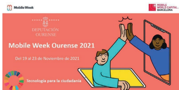
Imagen 1. Banner de la Mobile Week de Ourense ‘21

Durante el pasado mes de noviembre del año 2021 se celebró la Mobile Week de Ourense’21, un evento social que ha marcado un antes y un después en la cuestión social a tratar: la digitalización de la sociedad rural y la promoción de la España despo- blada o vaciada. La Fundación Mobile World Capital Barcelona, la Diputación de Ourense y la Red Mundo Atlántico preocupados por el progreso tecnológico con la ciudadanía (rural) provocaron una reflexión colectiva acerca del impacto social de la tecnología en las personas y en los espacios que ocupan y habitan. La transparencia en la información, la creación de agendas públicas y privadas comprometidas, la digitalización inclusiva, la experiencia del usuario en la conformación de las realidades, así como la humanización y la ética en un mundo que evoluciona fueron los pilares del debate generado. El “espí- ritu Ourense” co-creado se podría resumir en tres ideas: