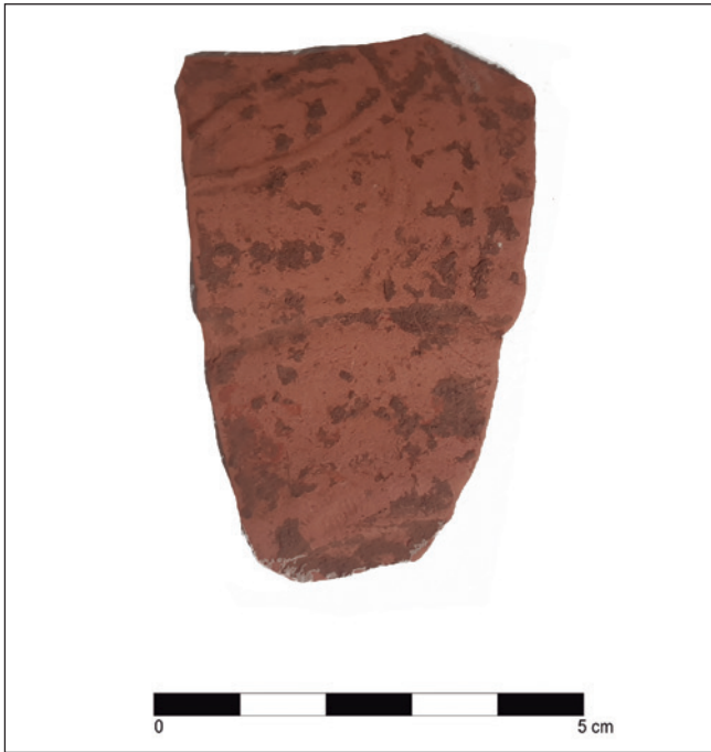
FIGURA 9: Fragmento de una cerámica TSH con sus característicos segmentos en el interior de grandes círculos.

de decoraciones; vislumbrándose que la última de estas aplicaciones se remata por encima de las teselas del mosaico, estableciendo así la relación de temporalidad.