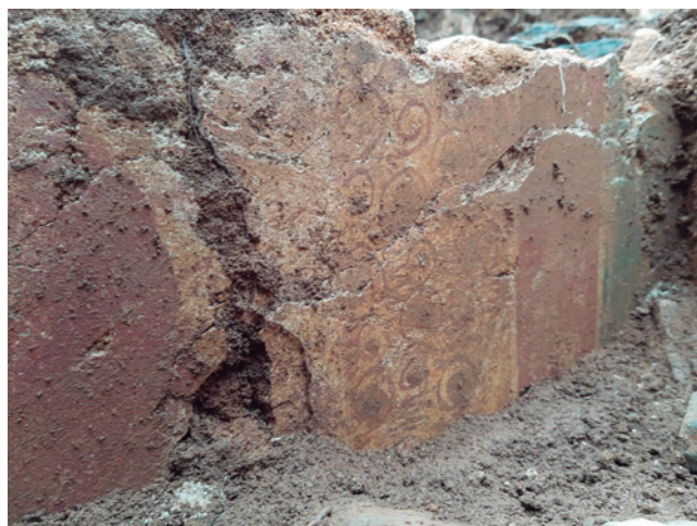
FIGURA 8: Detalle de las pinturas del paño noreste del triclinium , se aprecian el círculo rojo, con las espirales esquemáticas y las bandas continuas de enmarque.

Además de eso, en la cabecera oriental de la habitación, vuelve a romperse esta regularidad decorativa; paten-