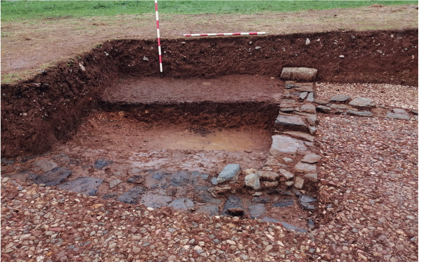
FIGURA 12: Fotografía de la campaña de 2020. Se aprecia el patio norte y el pavimento de piedra caliza regular. Los límites de este solado son las bases de las paredes y muretes del patio y las habitaciones paralelas.

estudio de la historia antigua de Asturias y a la tardoantigüedad es de un valor incuestionable.