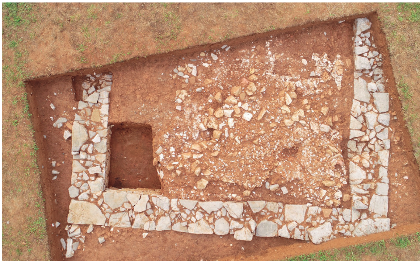
FIGURA 4: Ortofoto del edificio auxiliar excavado en 2020.

se localizó una pieza de cerámica común, casi completa, y fragmentos de terra sigillata hispánica tardía . Este estrato, resultado de la actividad de rebusca, con claros tintes de spolia y reaprovechamiento de la ruina del edificio, enmascaraba las evidencias constructivas primigenias. Estas pertenecen a una antigua residencia romana de la que se conservan muros de 56 cm de anchura con un alzado de 30 cm y un revoco decorado.