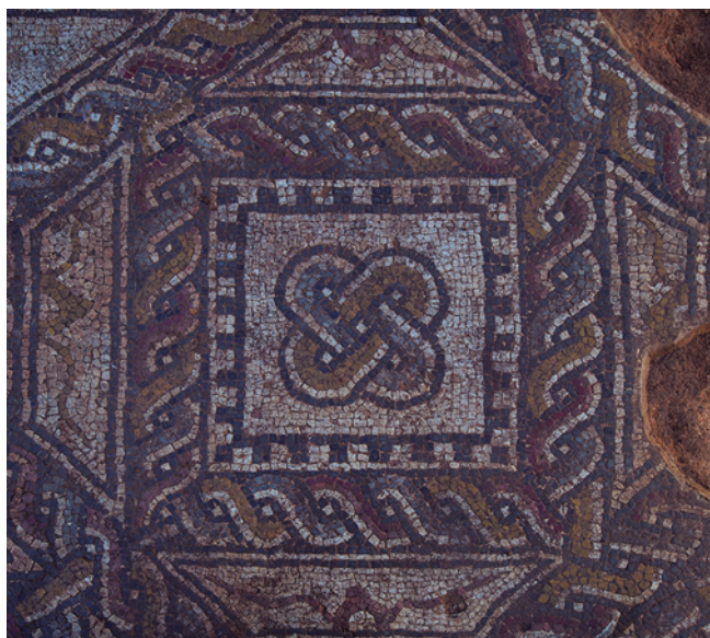
FIGURA 5: Detalle de uno de los nudos de dos eslabones del mosaico.

serie de anomalías que pueden identificarse o corresponder con evidencias arqueológicas soterradas. En este sentido destaca la zona de investigación 1 (finca El Pedregal), donde en años previos se detectó el mosaico romano y en la que las ondas de penetración terrestre sugieren que existe un complejo arqueológico de notable envergadura, apreciándose varios edificios y otras estructuras secundarias de menor porte; en el interior de uno de los edificios de mayor dimensión se identificaron anomalías que se interpretan como pavimentos, indicándonos el ámbito en el que probablemente se conservan suelos originales.