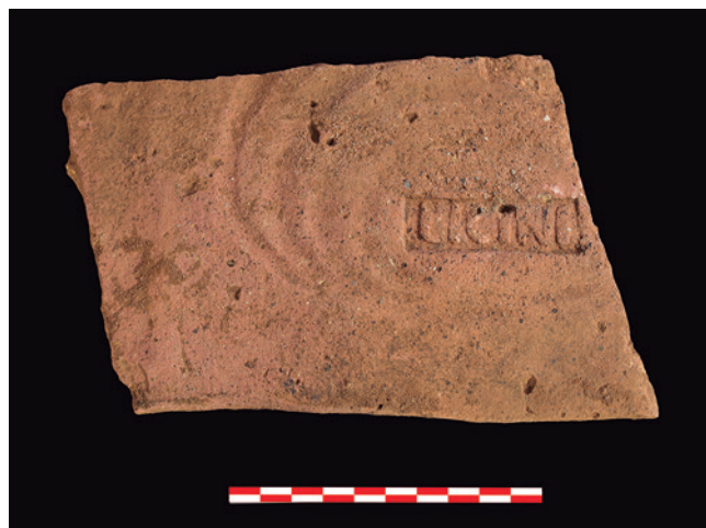
FIGURA 6: Fragmento de latericio con el sello de Licini recuperado en 2018.

Tal y como recogía el proyecto de 2019, el equipo arqueológico se centró en la excavación del mosaico lo-