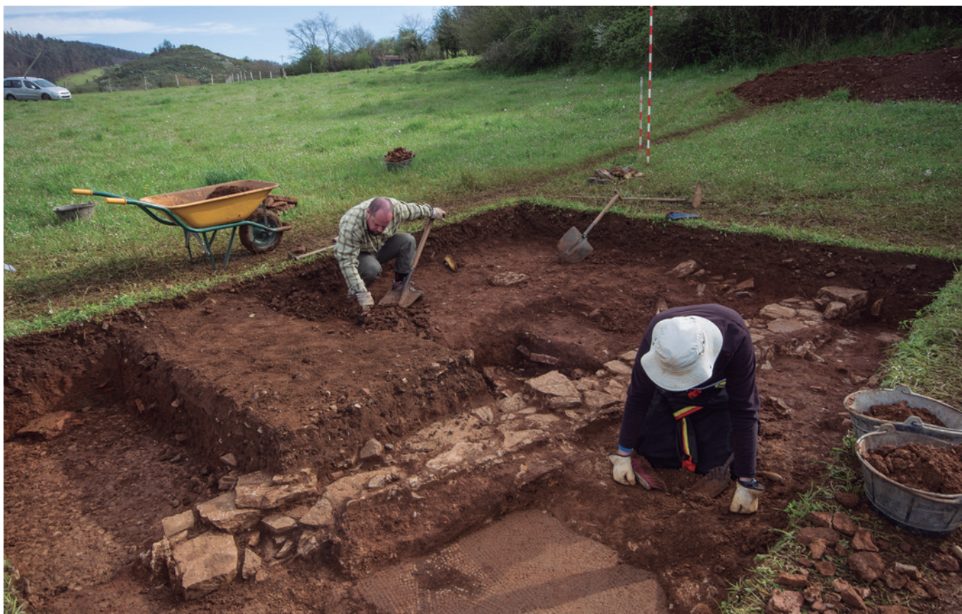
FIGURA 3: Imagen de la campaña de 2018.

El primer trabajo que se realizó fue el topografiado de la finca El Pedregalón o El Pedregal , para tener así una planimetría inicial del lugar, fijando virtualmente una malla o retícula de cuadros de 5 metros de lado que compartimentan el terreno. Este reticulado está orientado al norte y permite un alargamiento infinito en las cuatro direcciones.