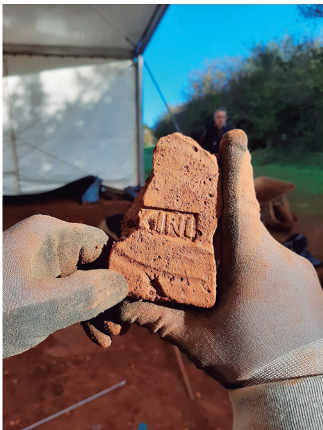
FIGURA 7: Fragmento de latericio de Licini hallado en 2019.

en cuyos interiores se alternan cuadrados, nudos de dos eslabones y flores de cuatro pétalos.