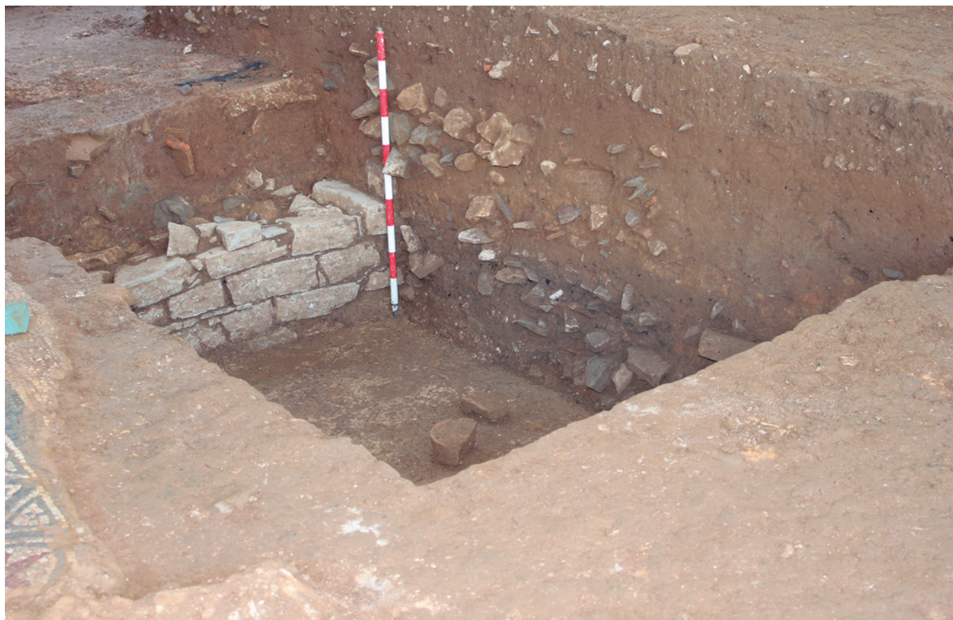
FIGURA II: Detalle de la cella caldaria o hipocausto que soportaba el pavimento calefactado.