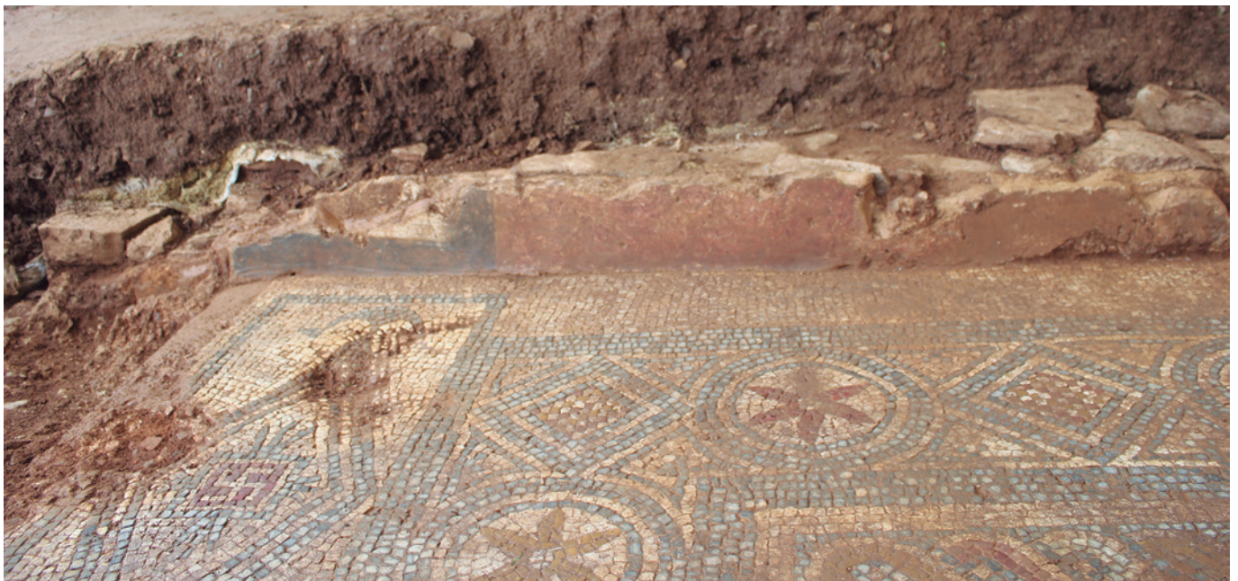
FIGURA 10: Vista frontal de las pinturas de la pared norte de la habitación. El enmarque negro rodeaba la puerta noroeste. El conjunto es de motivos florales y vegetales sobre un color rojizo.

Por igual, los ladrillos que configuraban las pilae de este hypocaustum tenían sección circular, preservándose apenas restos de los bipedalia que se asentaban sobre dichas columnillas.