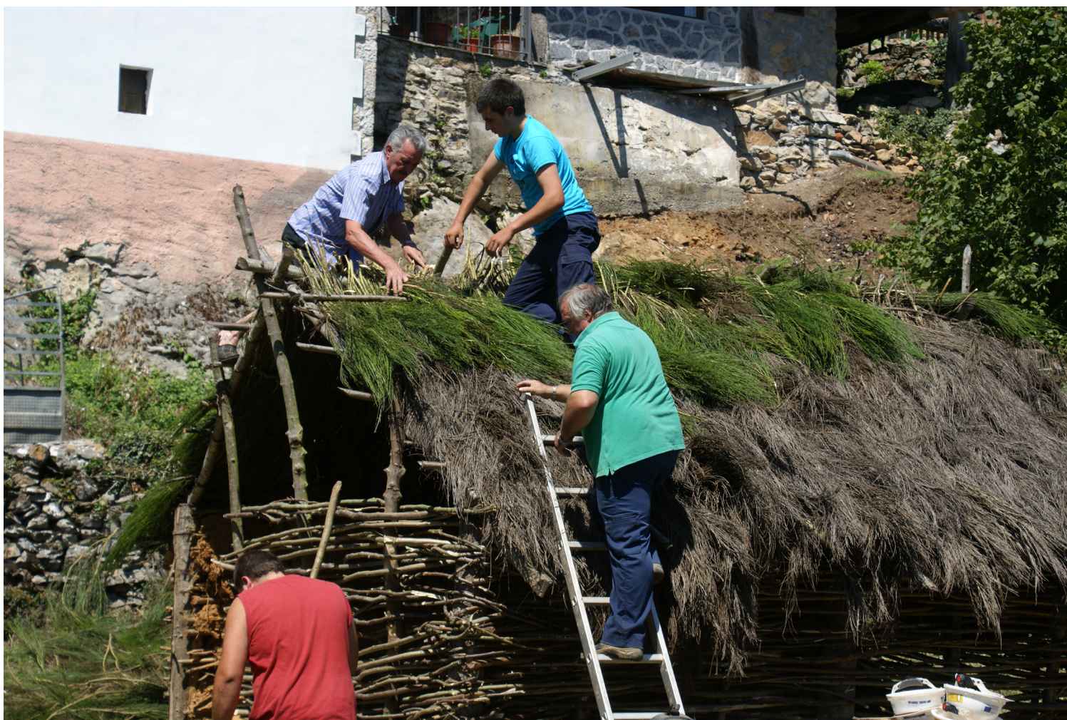
Construcción de una cabaña de techo en los talleres arqueológicos de Vigaña, año 2015.