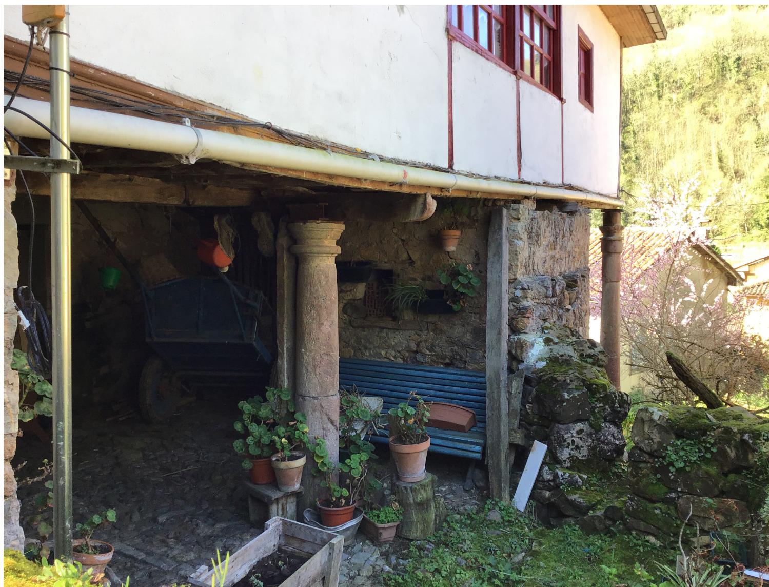
Imagen tomada para el inventario de los restos constructivos del monasterio reutilizados en las viviendas de Balmonte.

Todo este proceso de investigación previa tuvo como objetivo final la intervención arqueológica en el propio yacimiento del convento.