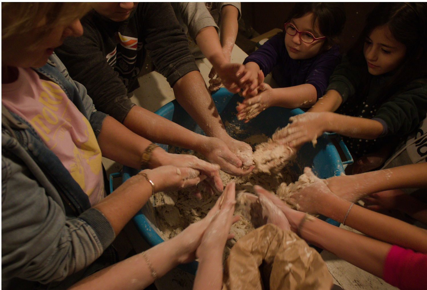
Taller de amasado de pan con el colegio público de Balmonte.

Los talleres de modelado, torneado y cocción de cerámica han tenido una acogida muy positiva y con ellos se lograba conjugar la metodología arqueológica (estudio de la cultura material), con las técnicas y saberes del artesanado local. De la misma manera, el taller de cocción de pan y los de tradición oral fomentan las relaciones intergeneracionales, favorecen la transmisión del conocimiento local y ponen en valor los conocimientos etnohistóricos y familiarizan al alumnado con la etnografía y el patrimonio inmaterial de su territorio.