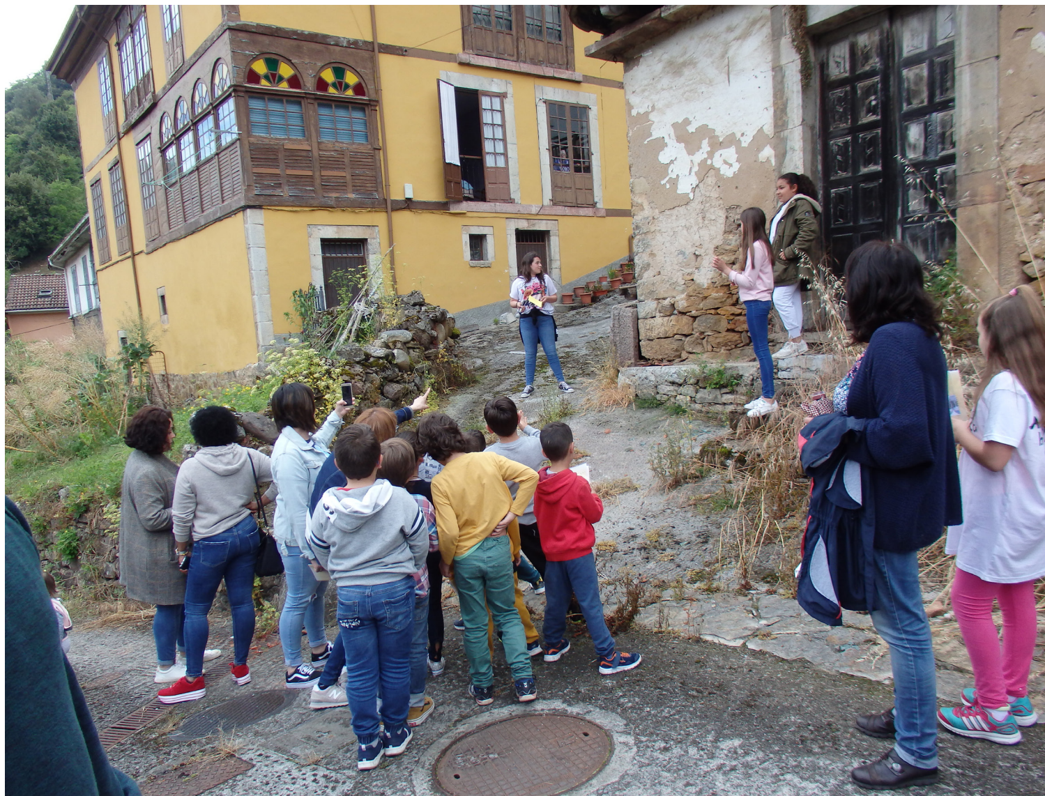
Itinerario realizado por el alumnado, “Las chalgas de los escolinos”.

Pero sin duda la actividad que más repercusión ha tenido ha sido la ruta las chalgas de los escolinos. Esta actividad comenzó siendo un itinerario interpretativo que el alumnado de 6º curso realizó el día de final de curso. En el recorrido se mostraron los restos materiales inventariados del monasterio que se conservan en la villa de Balmonte. Debido al interés despertado por esta ruta y gracias a la colaboración del Ayuntamiento y la Agencia de Desarrollo Local, actualmente este itinerario ha sido señalado y forma parte de los activos turísticos del municipio, completando de esta manera el proceso de aprendizaje servicio hacia la comunidad.