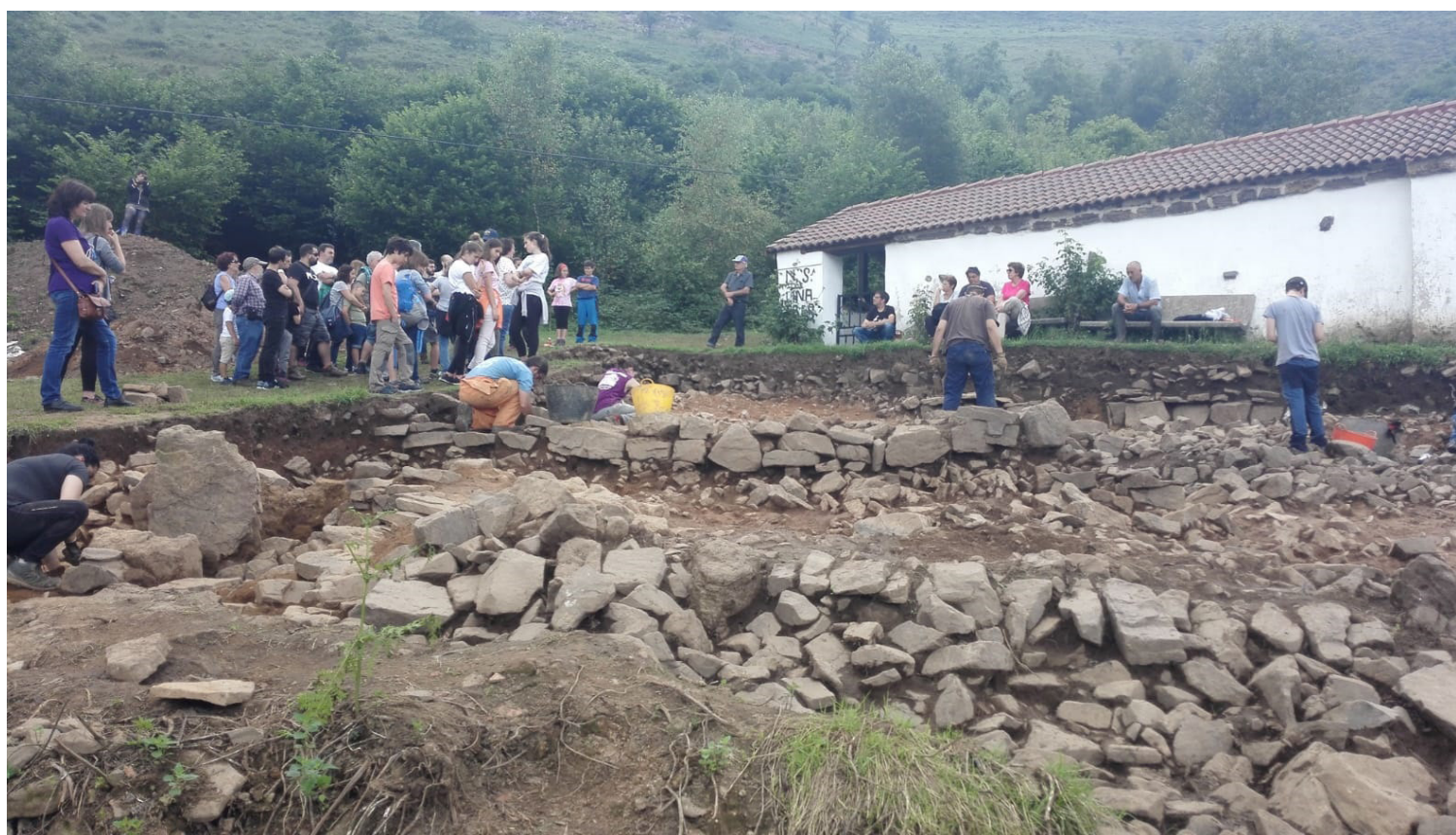
Visita guiada al lugar de L.linares en el año 2018.

En un primer momento nos planteamos las actividades formales de divulgación de nuestros avances científicos: charlas divulgativas, visitas guiadas a los yacimientos en los que estábamos interviniendo, el uso de las redes sociales y un blog en el que dar a conocer los primeros resultados... Pero estas actividades divulgativas, que tuvieron un éxito relativo y que aún seguimos realizando en la actualidad, llegaban sólo a un determinado público y con ellas no se lograba una verdadera implicación de las poblaciones locales. La mayor parte de los asistentes eran gente del gremio -profesionales de la arqueología y el patrimonio interesados en el avance de las investigaciones-, turistas -el carácter estival de los trabajos arqueológicos favorece conectar con el turismo rural que se aloja en la comarca- o residentes de las grandes ciudades que teniendo sus raíces en los pueblos del municipio retornan o pasan sus vacaciones en la casa familiar. En definitiva, usuarios de grandes contenidos acostumbrados a disfrutar de una amplia gama de actividades de carácter divulgativo y cultural. Sin embargo, las poblaciones locales, objeto y sujeto de nuestras investigaciones, no se sentían ni atraídas ni identificadas con este tipo de iniciativas.