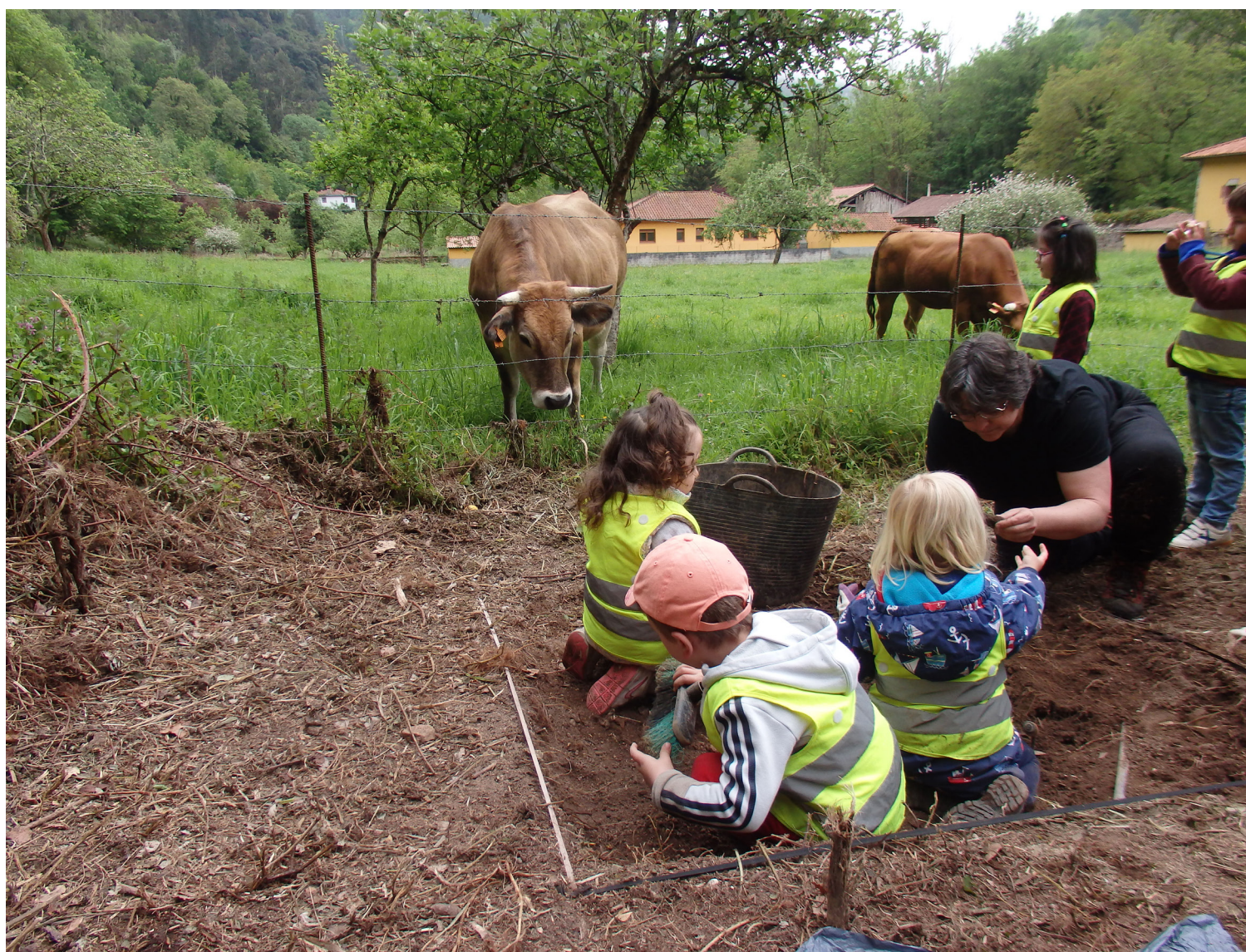
Proceso de excavación en el monasterio de Santa Maria de Lapedo.

Esta actividad fue en una experiencia muy enriquecedora para el alumnado, que disfrutó del trabajo de campo identificándose con las labores de la arqueología. Una anécdota con el alumnado de infantil ilustra sobradamente la motivación que tenían con la excavación: de cara a la celebración del carnaval, que se había planteado con temática arqueológica, interrogados sobre de quien se querían disfrazar (Indiana Jones, Tadeo Jones, Lara Croff...) su respuesta fue disfrazarse del grupo de arqueólogas y arqueólogos del LLABOR.