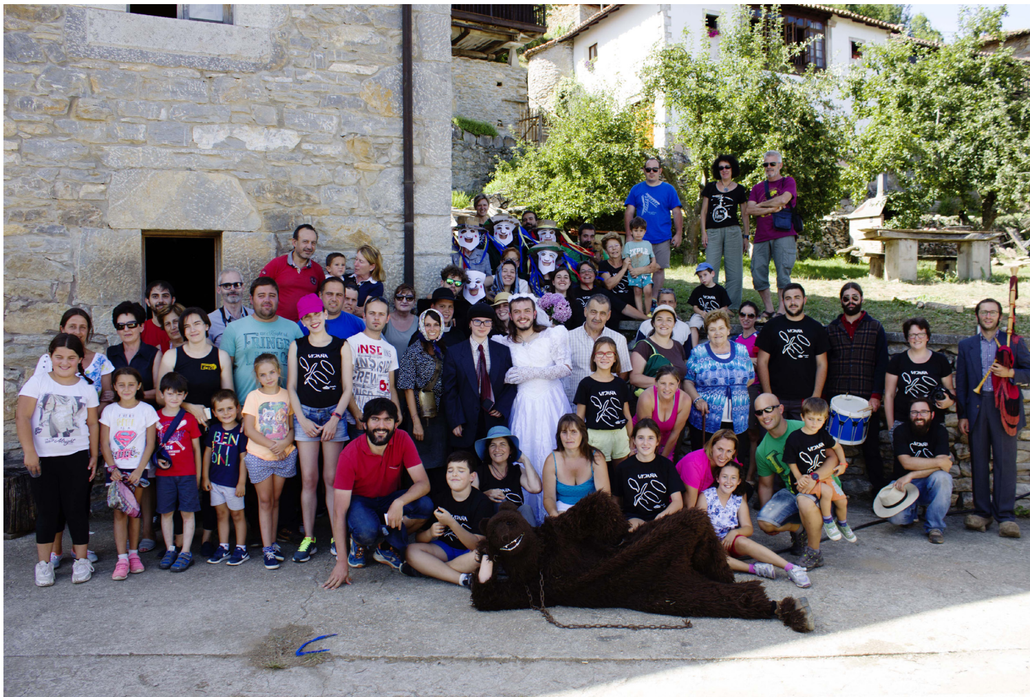
Mazcaritos y participantes en los talleres arqueológicos de Vigaña, año 2018.