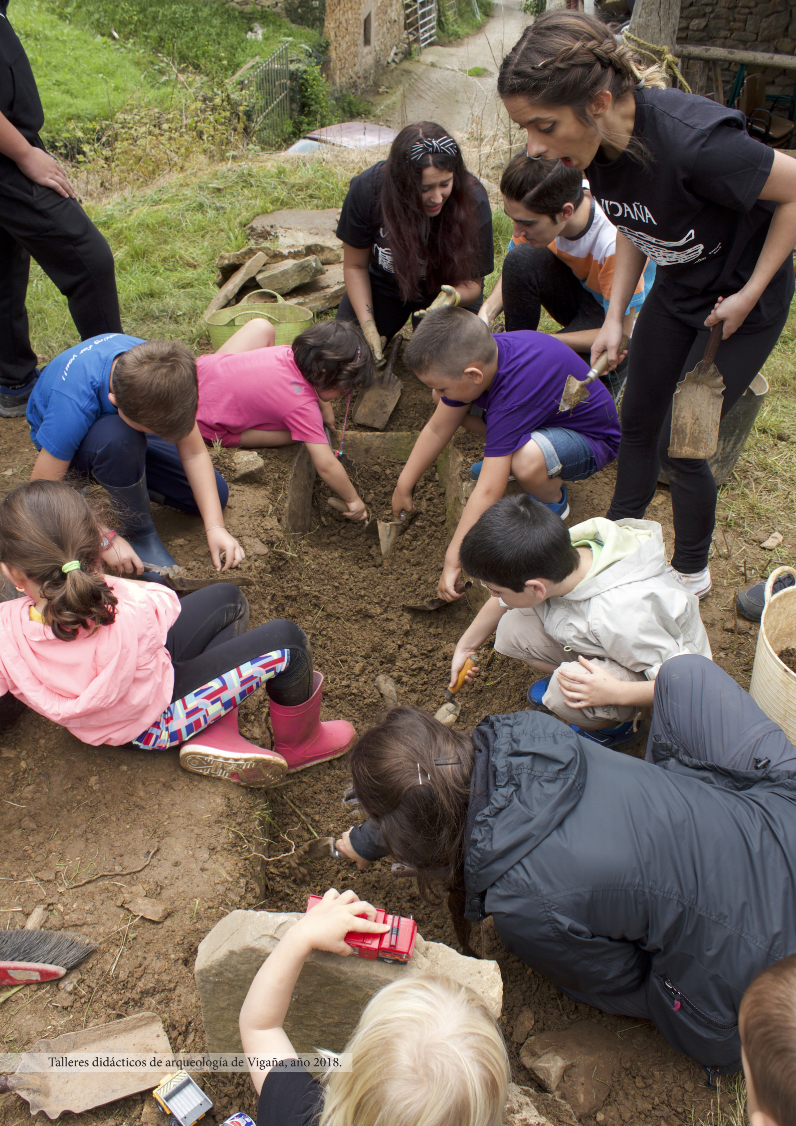
Talleres didácticos de arqueología de Vigaña, año 2018.