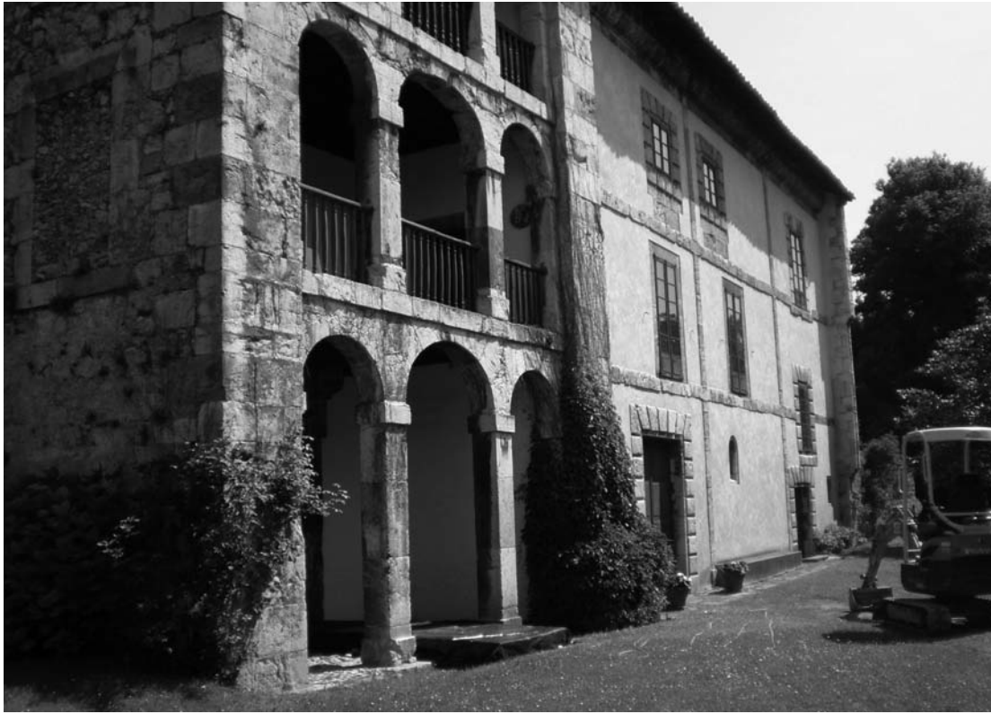
Fig. 3. Fachada meridional de El Cercao y capilla de la Concepción, finales del siglo XVI. Fotografía Marta Álvarez Carballo.

líneas 21 . Asimismo, contigua al muro oriental de la residencia, se conserva la base de una estructura turriforme de planta cuadrangular en cuyos extremos se dispusieron cuerpos cilíndricos, seguramente edificada en el transcurso de los siglos XIV o XV, y cuya ubicación remite a la cuidada parcelación bajomedieval de la villa 22 . Del mismo modo, los hórreos mencionados en las distintas fuentes documentales manejadas han desaparecido por completo, quizás a causa de su pérdida de funcionalidad 23 .