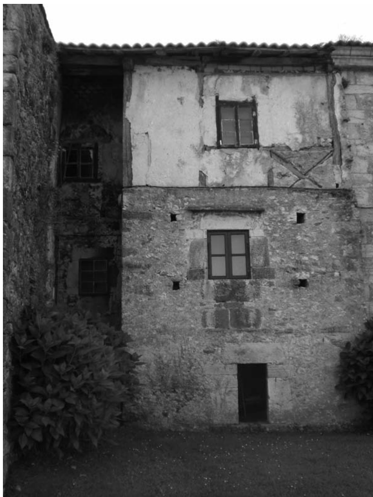
Fig. 1. Fachada septentrional de El Cercao (detalle), décadas centrales del siglo XVI.

sas que Hernando de Posada y su esposa declaraban haber hecho y fabricado entre los años 1562 y 1574. Las nuevas fachadas resultantes presentan características análogas a la vivienda no ampliada: muros levantados en mampostería, uso del sillar dispuesto a soga y tizón en los extremos de la edificación y utilización de piedra de buena labra en los enmarques de puertas y ventanas, único elemento ornamental de la fachada. Sin embargo, una peculiaridad estructural, motivada por la pronunciada caída del tejado, las diferencia del inmueble contiguo. La prolongación de la techumbre, elemento que cohesionan el conjunto, ha determinado que el piso superior presente una altura menor. Asimismo, el amplio vano que horada el segundo nivel ha sido sustituido por una ventana de reducidas dimensiones y, puesto que la iluminación y ventilación del espacio interior no sería