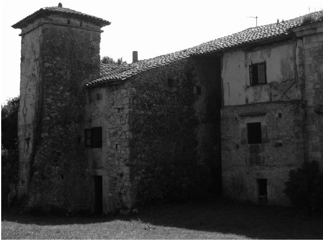
Fig. 2. Fachada septentrional de El Cercao , décadas centrales del siglo XVI.

miento orgánico a través de la adición de varios elementos en torno a las tres viviendas iniciales y por la clara intencionalidad de los Posada por mantener unidas sus propiedades. De este modo, el sector noroeste del recinto se peculiarizó por la convivencia de una arquitectura residencial con otra de carácter más funcional, materializada a través de la presencia de hórreos y hornos. Sin embargo, el verdadero artífice de la residencia fue Pedro Junco de Posada pues, al edificar una nueva fachada en el lado meridional y su capilla-panteón adosada al muro occidental de la estructura, ésta adquirió su configuración definitiva.