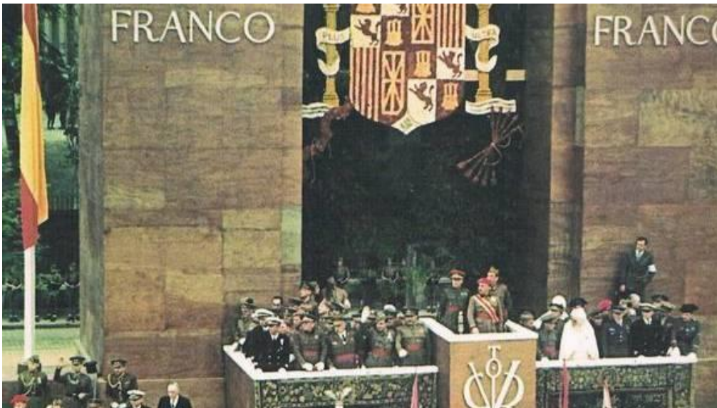
Figura 5. Primer plano de Franco en la tribuna que presidía el primer desfile del Día de la Victoria. Consultado el 20/06/2022 a las 13:15. https://fnff.es/actualidad/110135980/1-de-Abril-dia-de-la-Victoria.-Por-el-General-Chicharro.html

https://commons.wikimedia.org/w/index.php?search=valle+de+los+caidos+1940&title=Special:MediaSearch&go=Go&type=image