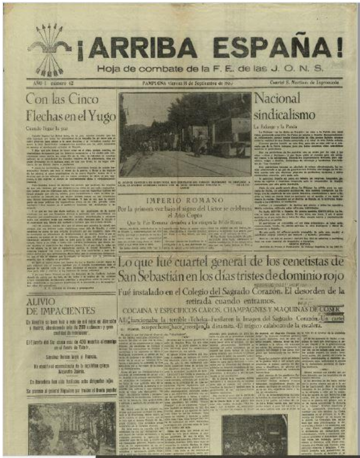
Figura 6. Recorte de la portada del periódico falangista de Pamplona, ¡Arriba España! a 15 de septiembre de 1936. Consultado el 26/06/2022 a las 16:45 https://www.euskalmemoriadigitala.eus/handle/10357/56410