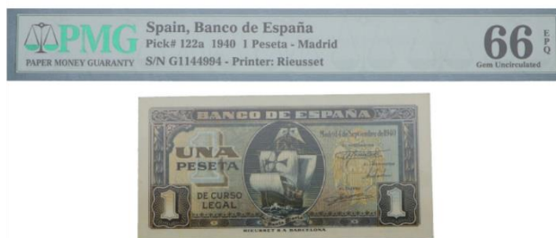
Figura 3. Billete de una peseta de 1940 con la Santa María dibujada en su centro.

https://www.numismaticarovira.com/shop/index.php?id_product=18493&controller=product