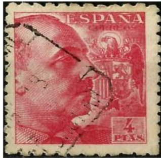
Figura 2. Sello expedido desde 1940 hasta 1945 con la cara de Franco y el Escudo Nacional de fondo. Consultado el 17/06/2022 a las 19:00.

%20Diario%20Espa%C3%B1ol%20%28none%29%2019/01/1939.%20P%C3%A0gina%204