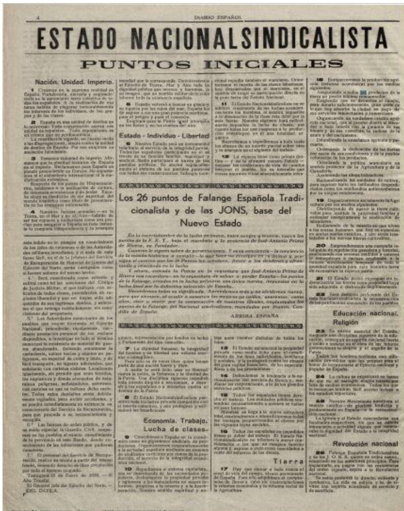
Figura 1. Portada del periódico Diario Español de Tarragona a 19 de enero de 1939.

Consultado el 07/06/2022 a las 16:18 de http://web.tarragona.cat/pandora/cgi-bin/Pandora?fn=commandselect;query=id:0000317437;command=show_pdf;texto=%20