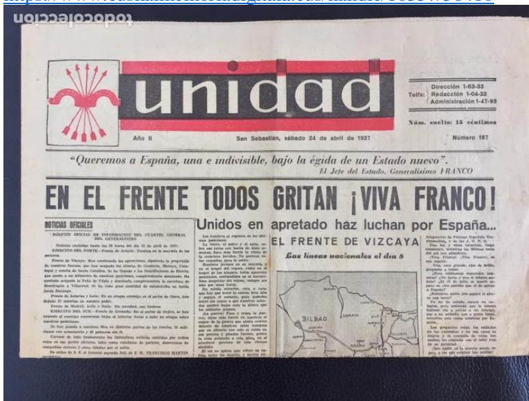
Figura 7. Recorte de la portada del periódico falangista de San Sebastian, Unidad a 24 de abril de 1937. Consultado el 26/02/2022 a las 16:54 https://www.todocoleccion.net/coleccionismo-revistas-periodicos/periodico-unidad-san-sebastian-24-abril-1937-guerra-civil-falange-espanola~x95491098