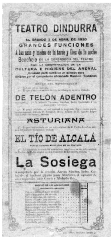
Ilustración 1. Programa de la velada organizada por Cultura e Higiene en el Teatro Dindurra, el 3 de abril de 1920.

tablecimiento, contó con un variado programa de números teatrales y musicales (véase Ilustración 1), que transcribimos a continuación: