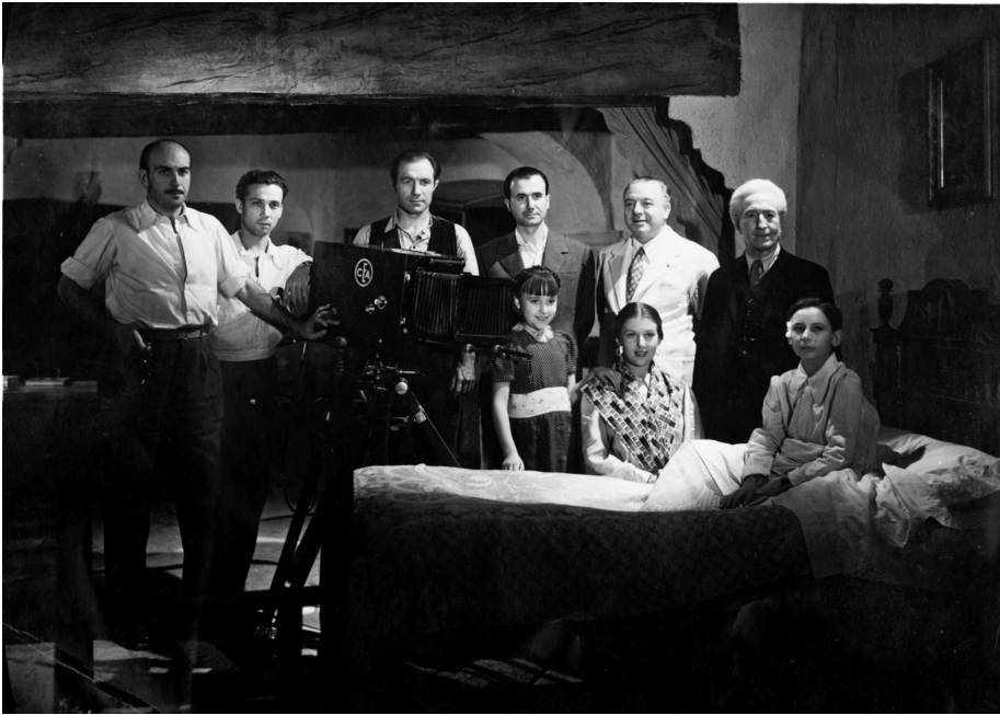
Imagen 2. Jacinto Guerrero junto a parte del equipo durante el rodaje de la escena final de El camino del amor , 1943.

La hija del engaño , pero ya sin la música de Guerrero. Y es de notar que, según algunas informaciones la película de 1935 tuvo música adicional de Fernando Remacha.