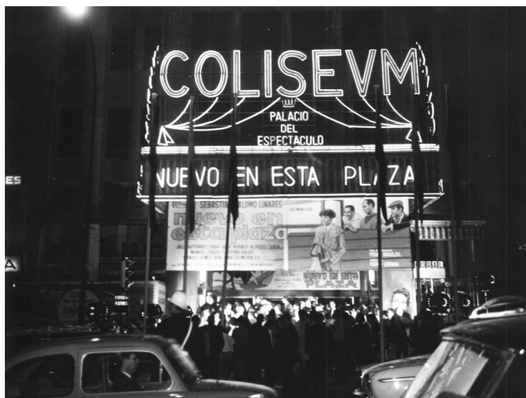
Imagen 5. El Teatro-Cine Coliseum.