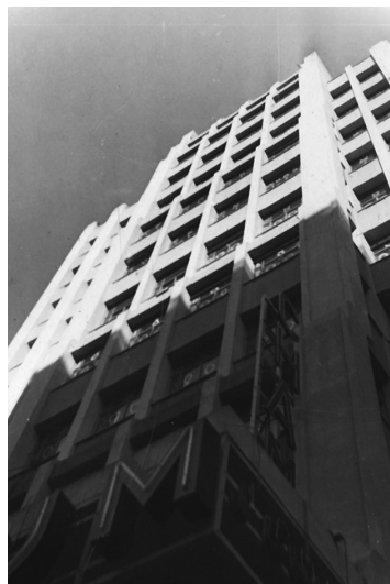
Imagen 6. El Teatro-Cine Coliseum.

pares antes de llegar a la Plaza de España, cuya planta baja sería el Cine-Teatro Coliseum. Se inauguró en 1933 y es obra de dos arquitectos excelentes. Casto Fernández-Shaw era hijo del libretista de La revoltosa o de La vida breve y había conocido a su colaborador Pedro Muguruza en el estudio de Antonio Palacios durante el concurso para otro edificio madrileño emblemático, el Círculo de Bellas Artes en la calle de Alcalá. Con otro hijo del primer Fernández Shaw y también libretista, la relación de Guerrero fue en estos años muy intensa: el 14 de marzo de 1930, por ejemplo, se había estrenado en el Teatro Calderón de Madrid, con libreto de Federico Romero y Guillermo Fernández-Shaw, La rosa del azafrán , uno de los grandes éxitos de la zarzuela en general. Allí, en el Coliseum, tuvo durante muchos años su sede la compañía lírica del maestro Guerrero, alternando sus funciones con proyecciones cinematográficas 47 . Hace tiempo que el cine-teatro ha pasado a otras manos, pero aún mantiene allí su sede la Fundación Jacinto e Inocencio Guerrero 48 .