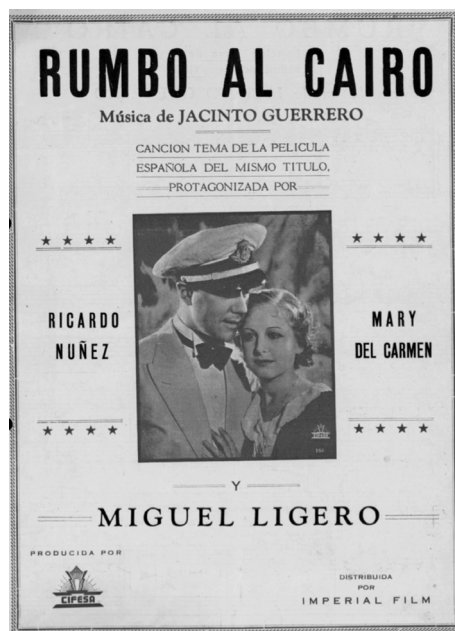
Imagen 4. Cartel de la película Rumbo al Cairo .

Siguiendo ejemplos entonces recientes y hoy también muy ilustres, como el llamado Palacio de la Música en el n.º 35 de la Gran Vía, obra del luego académico Secundino Zuazo, fechada en 1926, más tarde sala de conciertos, pero que desde 1928 alternó su actividad musical también con el cine, Jacinto e Inocencio Guerrero idearon un edificio de viviendas en el n.º 78, el penúltimo de los