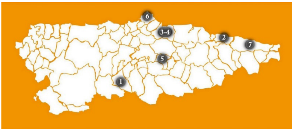
Figura 1. Distribución geográfica de la muestra (Nota: 1=Parque de la Prehistoria; 2=Centro de Arte Rupestre de Tito Bustillo; 3=Termas Romanas de Campo Valdés; 4=Museo del Ferrocarril de Asturias; 5=Museo de la Siderurgia; 6=Museo Marítimo de Asturias; 7=Museo Etnográfico del Oriente de Asturias).

Se configura una muestra de 7 museos de patrimonio histórico y etnográfico (Figura 1), elegidos intencionalmente a partir de un estudio previo (Suárez, 2017), buscando la diversidad temática, tipológica y geográfica. En ellos se ha realizado un seguimiento de 40 visitas guiadas en las que han participado sendos grupos escolares con un total de 843 estudiantes y 18 educadoras de museo.