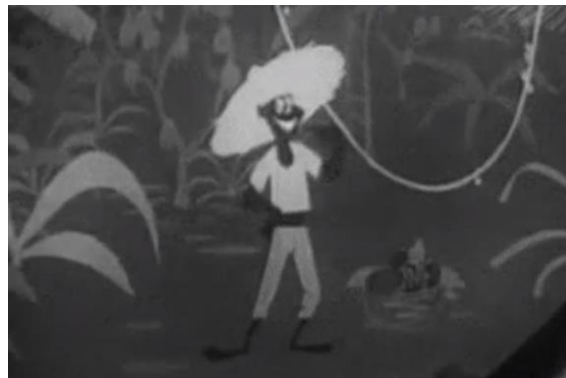
Imagen 5: Anuncio Cola Cao

En la primera parte de este anuncio se muestra el producto en su origen, a través de una vía racional y con una canción atemporal que se ha ido adaptando y que aún perdura hasta día de hoy. En él te enseñan al “ negrito del África tropical ” que está recogiendo el cacao para que tú, desde España, puedas tomar luego el producto final;