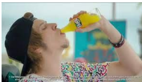
Imagen 2: Campaña Fanta Rubius "Girando la botella"

Otra acción publicitaria que se hizo viral fue la de Willyrex y AuronPlay colaborando con ColaCao a través de las Redes Sociales de ambos (Instagram, Twitter y Twitch):