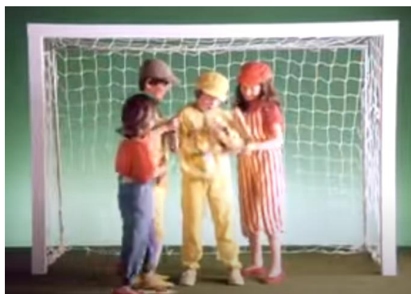
Imagen 7: Anuncio Bollycao

Haciendo referencia a lo antiguo y viendo esto como peor y atrasado, el anuncio comienza con una toma en blanco y negro y con una voz femenina con tono triste que podría ser de madre diciendo: '¿Te acuerdas del pan y chocolate de antes?'; justo