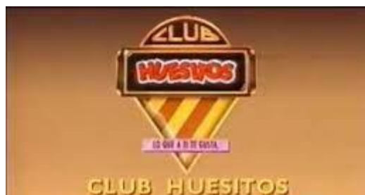
Imagen 8: Anuncio Club Huesitos

En los años 90 y más específicamente en este anuncio, comenzamos a ver nuevas técnicas que las marcas usan a modo de branding y de engagement . Pues es en esta década cuando oímos hablar por primera vez de los programas de fidelización.