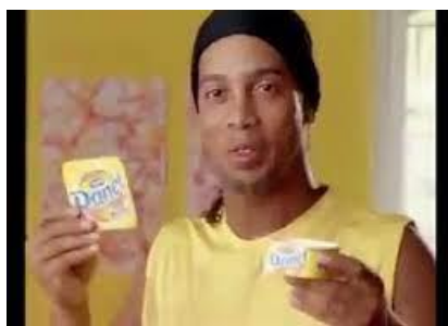
Imagen 9: Anuncio Danet y Ronaldinho

La llegada del nuevo siglo trajo consigo nuevas técnicas, en este caso la primera de ellas es mostrar beneficios que el producto podría tener respecto a otras marcas, explicando que es más sano, en este caso porque Danet tiene '+ sabor ' y ' 10% menos de azúcar '. Otra técnica fue empezar a usar a personajes famosos e ídolos de los niños, en este caso a modo de narrador tenemos Manolo Lama y a modo de actor a Ronaldinho haciendo freestyle .