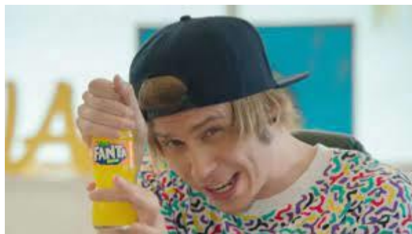
Imagen 10: Anuncio Fanta y Rubius

Este spot pertenece a una de las mayores campañas hechas por Fanta en toda su historia y promocionó la nueva forma de sus botellas. Fue la primera empresa que optó por el uso de influencers como medio de comunicación y promoción en sus campañas televisivas.