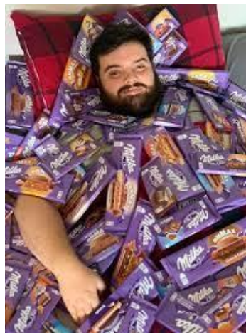
Imagen 4: Campaña en Instagram y Twitch de Milka e Ibai Llanos

O las campañas del influencer más de moda en España, Ibai Llanos, con Doritos, Domino's Pizza o con chocolates Milka y con Nestlé Jungly que, aunque sean competencia directa entre ellas comparten influencer debido a la repercusión y al impacto que consiguen: