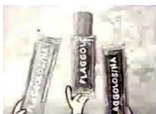
Imagen 6: Anuncio Flaggolosina