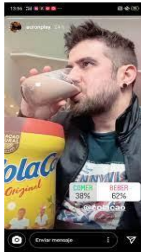
Imagen 3: Campaña en Instagram de Colacao y Auronplay

O las campañas del influencer más de moda en España, Ibai Llanos, con Doritos, Domino's Pizza o con chocolates Milka y con Nestlé Jungly que, aunque sean competencia directa entre ellas comparten influencer debido a la repercusión y al impacto que consiguen: