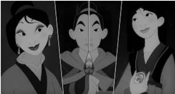
Figura 3. Mulán como figura feminista. Imagen editada

El objetivo de la actividad es que los diferentes integrantes del grupo compartan con el resto aquello que han anotado en la tercera columna de su tabla de observación. Puesto que cada alumno o alumna ha apuntado de forma individual lo que le ha llamado la atención, vamos a encontrar anotaciones muy diversas dentro de cada uno de los grupos. Gracias a ello, los alumnos y alumnas podrán completar su tabla de observación con elementos de carácter sexista de la película que habían pasado por alto.