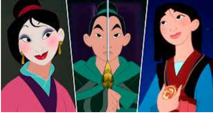
Figura 2. Mulán como figura feminista.