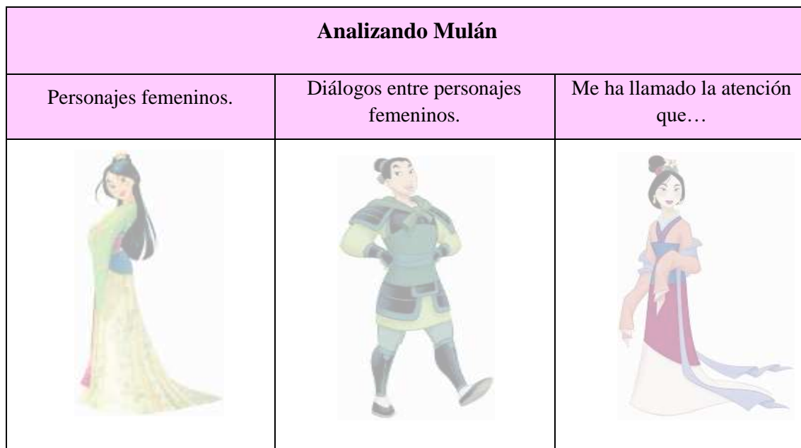
Tabla 3. Analizando Mulán (elaboración propia con imágenes extraídas de internet).

En ella, podemos observar 3 columnas diferenciadas que los alumnos y alumnas tendrán que cumplimentar con información extraída de la película. En la primera columna, deberán anotar los nombres de los personajes femeninos que aparecen en la película, en la segunda columna, deberán anotar los diálogos entre personajes femeninos, es decir, qué personajes son los que hablan entre sí y el tema principal de la conversación y , finalmente, en la tercera columna, deberán señalar aquellos elementos de la película que les hayan llamado la atención: una escena en la que se aprecia algún estereotipo de género, algún diálogo que les resulte sexista, la letra de alguna canción, etc.