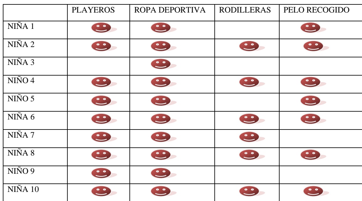
Tabla 2. Ejemplos de ficha de responsabilidades.

También tendremos una mascota, para llevar a los partidos. Al tratarse de un deporte colectivo, cada semana uno de los niños se llevará la mascota a su casa para el siguiente partido volver a compartirla con el resto del grupo.