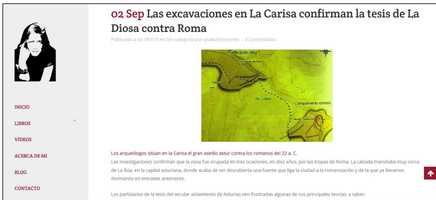
Figura 3: Captura de pantalla al artículo de Pilar Sánchez Vicente sobre las excavaciones de la Carisa que, según ella, dan credibilidad a su novela.