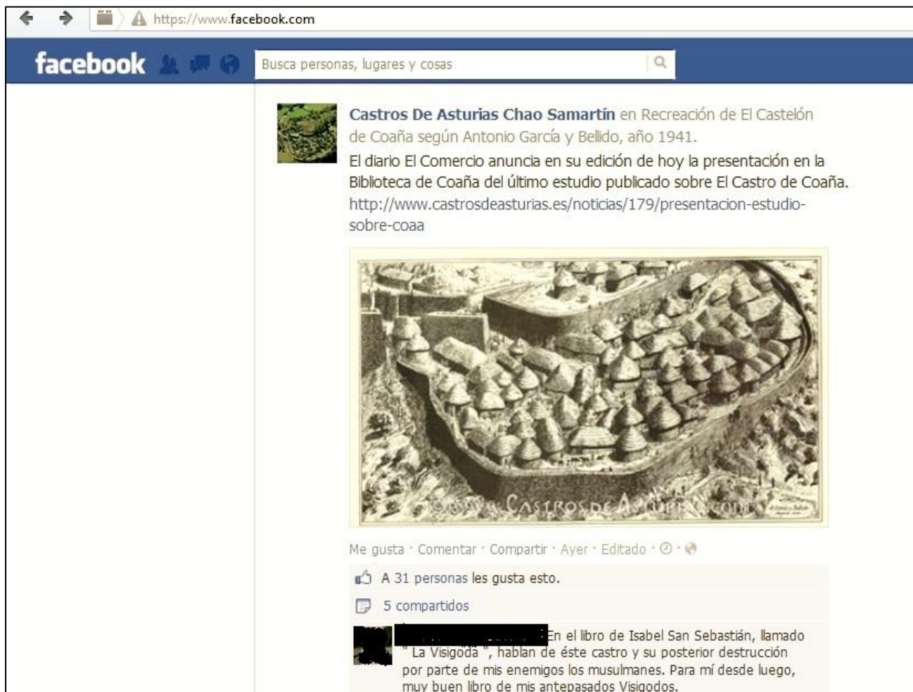
Figura 1: Captura de pantalla de la página de Facebook “Castros de Asturias” en la que se refleja el uso identitario del pasado a través de la lectura de una novela histórica.

de los astures, en gran parte seguimos siendo como nuestros antepasados”.