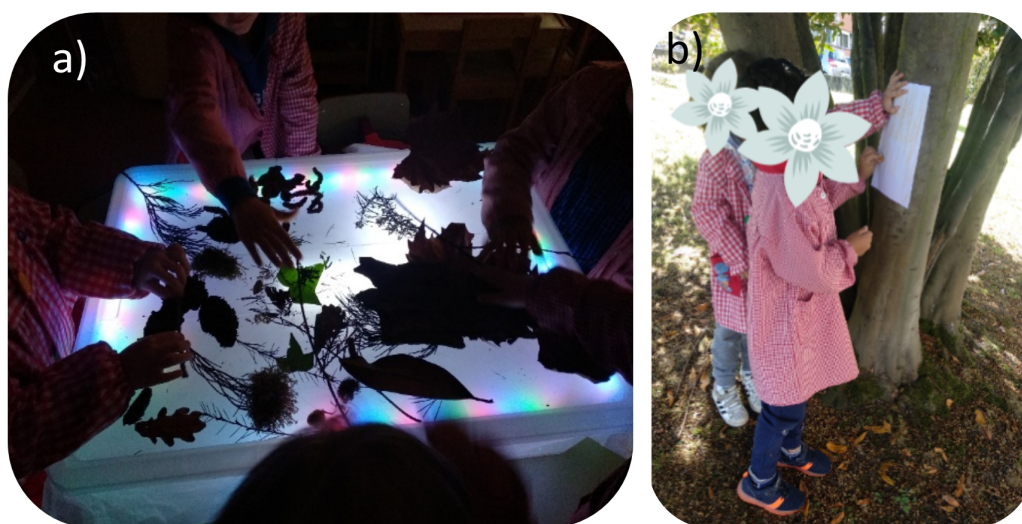
Figura 6. Experiencias sensoriales para aprender sobre algunas características de las plantas: a) explorando transparencias y formas hojas con la mesa de luz; b) explorando con el tacto y extrayendo calcos de las cortezas.

Se buscaron diferencias en forma, borde, tamaño y color de las hojas recogidas, con ayuda de una serie de tarjetas con imágenes simplificadas. Tras describir oralmente la hoja, el alumnado la intentaba identificar ayudándose de imágenes en libros sobre árboles (Figura 2), perfilándola en su cuaderno de campo y anotando forma y especie.