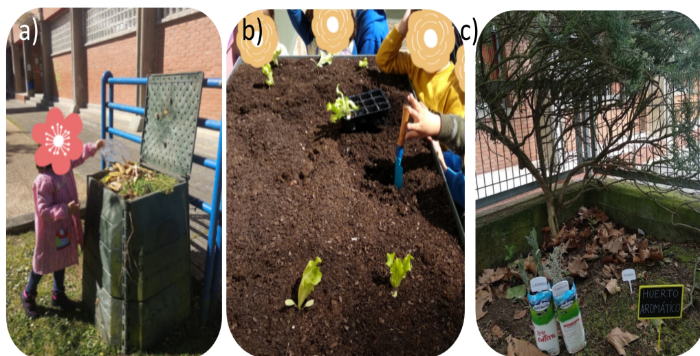
Figura 7. Algunas de las experiencias de introducción al huerto escolar: a) compostaje; b) plantación de lechugas en mesa de cultivo; c) establecimiento sector del huerto aromático.

Se buscó información sobre el romero en Internet, usos culinarios y medicinales. En el patio se observaron su aspecto y olor. Se cortaron ramitas e hicieron varios ramilletes, secándolos para hacer unos saquitos aromáticos, y se pegó una ramita junto a su dibujo en el cuaderno.