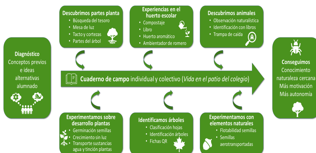
Figura 1. Diseño de la experiencia de aprendizaje de la naturaleza cercana en el patio escolar en segundo ciclo de Educación Infantil tomando como eje el cuaderno de campo individual y colectivo.

La experiencia ha partido de un diagnóstico inicial, en el que se ha valorado tanto la utilización previa del patio escolar y su potencialidad para el conocimiento del medio natural como los conceptos previos e ideas alternativas que presentaba el alumnado. En este sentido, el patio escolar se constituye en el lugar donde realizar fundamentalmente la experiencia, entorno pedagógico adecuado para desarrollar los procesos de enseñanza-aprendizaje de la naturaleza cercana. Atendiendo a ese diagnóstico inicial, y con modificaciones de acuerdo a la evaluación procesual llevada a cabo durante la experiencia, se organizaron actividades destinadas a mejorar el conocimiento del alumnado sobre las plantas y los animales del entorno cercano, a partir de experiencias centradas en el patio escolar, y apoyadas con algunas actividades realizadas en el aula con materiales y recursos obtenidos de dicho patio. Estas actividades se pueden agrupar en las orientadas a descubrir las partes de las plantas, experimentar sobre su desarrollo, trabajar el medio natural mediante diversas experiencias en el huerto escolar, identificar los árboles del patio, descubrir y observar a los animales presentes y experimentar con los elementos naturales disponibles, todo ello siendo registrado a través de los cuadernos de campo individual y colectivo (Figura 1).