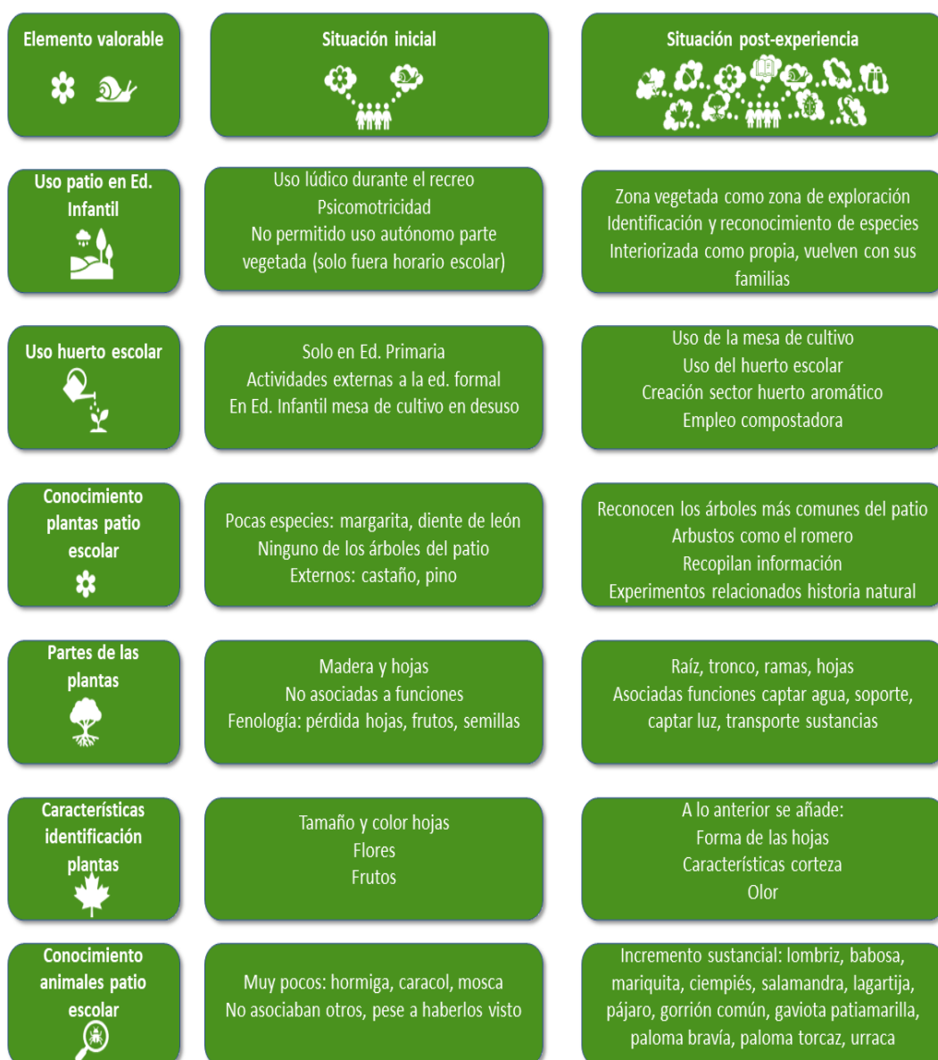
Figura 5. Cambios observados en el uso del patio escolar y el conocimiento sobre la naturaleza cercana del alumnado tras la realización de la experiencia didáctica.

como cuaderno de laboratorio para los experimentos, facilitando la reflexión y registro del procedimiento científico, importante también para trabajar el discurso y metodologías científicas en esta etapa (Aragón, Sánchez y Enríquez 2021; Cantó y Serrano 2017). El acto reflexivo a la hora de realizar apuntes gráficos (dibujos) y escritos (palabras claves y fechas) ha contribuido a un mayor conocimiento de la biodiversidad urbana. Al inicio, el alumnado apenas se había fijado en unas pocas especies de animales y plantas del patio escolar, mientras que ha terminado la experiencia conociendo bastantes de los árboles y arbustos, además de haber incrementado notablemente el número de animales y de observaciones sobre su historia natural. La potencialidad del uso del cuaderno de campo en el aprendizaje de la ciencia se ve favorecido por la capacidad del dibujo para desarrollar las representaciones mentales del alumnado (comprobado igualmente en otras etapas educativas: Gómez Llombart y Gavidia Catalán 2015), y afianzar así los conocimientos científicos observados (Katz 2017).