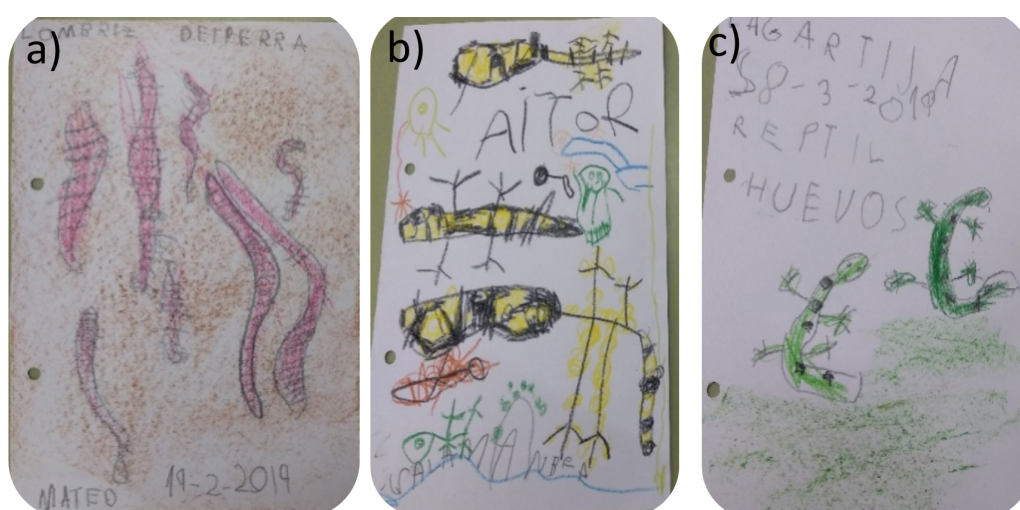
Figura 3. Recogida de información sobre animales encontrados en el patio escolar: a) lombriz de tierra, con dibujo en el que se observa su cuerpo alargado y anillado, identificación y fecha -el reverso de la hoja contenía las palabras clave anillos y compost-; b) apuntes gráficos sobre la salamandra, con su coloración aposemática; c) apuntes gráficos sobre las lagartijas, incluyen fecha de observación, grupo taxonómico y anotación sobre su historia natural.

El empleo esporádico de unos prismáticos permitió que el alumnado se familiarizara con esta herramienta, y facilitó la observación de animales presentes fuera del patio (como una vaca en los campos próximos). En el caso de las aves, se remarcaron las características diagnósticas más claras. Si bien la diversidad no fue muy amplia (gorrión común, gaviota patiamarilla, palomas bravía y torcaz, urraca), permitió que aprendieran sus diferencias y reforzar su interés en la actividad al poder identificarlas.