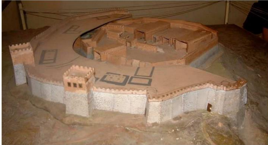
Maqueta de Troya VII