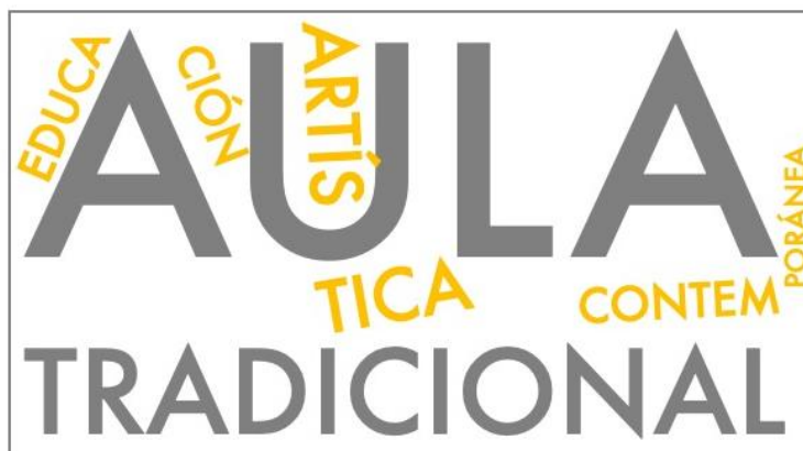
Figura 2. Esquema: educación artística en aula tradicional. Elaboración propia.

Desde nuestra propia práctica como docentes, observamos que la Educación Artística contemporánea parece no encajar en un aula tradicional. Un ambiente lleno de mobiliario, sin espacio libre que permita moverse o desplazarse por el aula dificulta generar experiencias artísticas basadas en un enfoque activo del aprendizaje. Así, como educadores y educadoras artísticas nos cuestionamos ¿es posible proponer dinámicas basadas en enfoques activos en estos contenedores pasivos? ¿Tiene cabida la Educación Artística contemporánea en un aula tradicional?