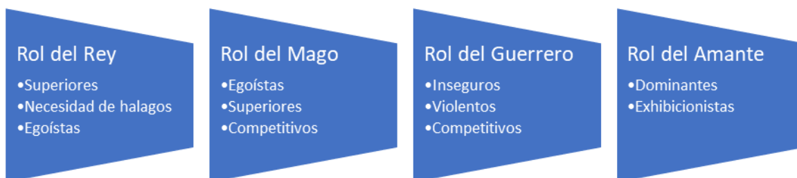
Imagen 3. Roles según la Ley del dominio y estereotipos en puteros y hombres.

En la imagen 3 se resumen los roles de la Ley del Domino en relación con las características de los puteros y los hombres.