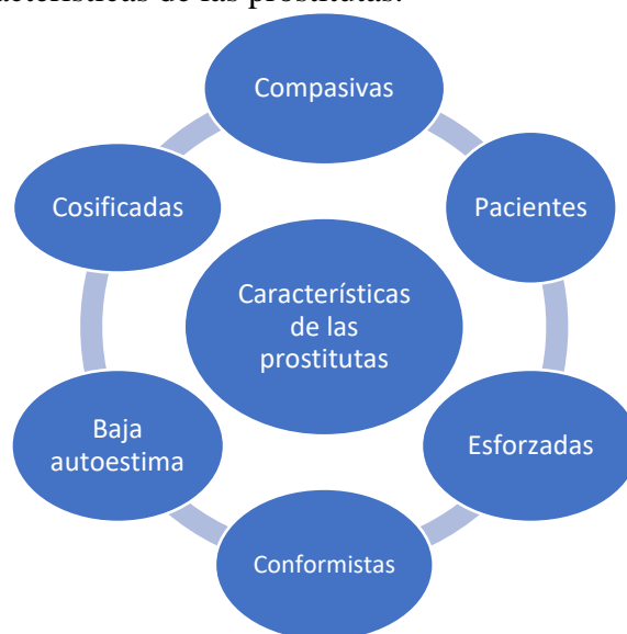
Imagen 2. Características de las prostitutas.