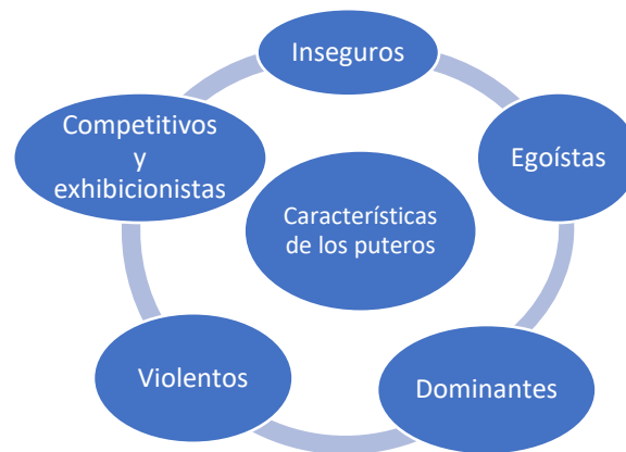
Imagen 1. Características de los puteros.

Una de las prostitutas menciona que “los hombres que les gusta el puticlub, les gusta lucirse entre sus amigos” (Güell, 2018, 24'20''). Por tanto, cuando los varones están en los clubes delante de otras personas como el grupo de iguales, siguen mostrando un rol de masculinidad debido a que no se encuentran en una esfera privada. Deben mostrar su rol de varón superior y fuerte para remarcar su masculinidad hegemónica.