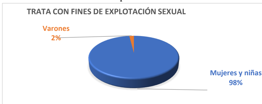
Gráfico1. Trata con fines de explotación sexual.

Hay que añadir que en el Informe Anual sobre Trata de Personas del Departamento de EE. UU. se refleja que cada año entre 600.000 y 800.000 personas cruzan las fronteras internacionales como víctimas de trata y de esta cifra, el 80% son mujeres (citado en APRAMP, 2011, p. 62). Además, 1.390.000 personas son víctimas de trata con fines de explotación sexual en todo el mundo (OIT, 2005, p.14). El 98% de víctimas de trata con fines de explotación sexual son mujeres y niñas, como se especifica en el gráfico 1 (O.I.T, 2005, citado en APRAMP, 2011, p. 63). Por otro lado, en la trata con fines de explotación económica o laboral son víctimas 2.450.000 personas, siendo el 54% mujeres y niñas (APRAMP, 2011, p. 64).