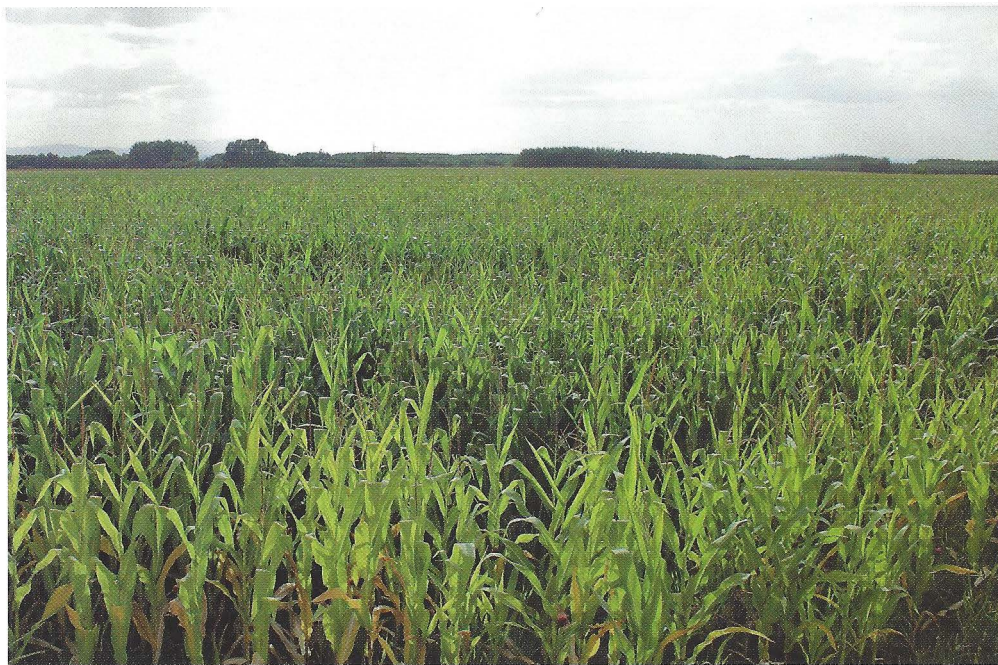
Fig. 1. El yacimiento de Huerga de Frailes no es reconocible hoy en superficie por las afecciones de las concentraciones parcelarias y el uso de maquinaria pesada en las labores agrícolas

DAVID GONZÁLEZ ÁLVAREZ, ANDRÉS MENÉNDEZ BLANCO, VALENTÍN ÁLVAREZ MARTÍNEZ & JESÚS IGNACIO JIMÉNEZ CHAPARRO 1