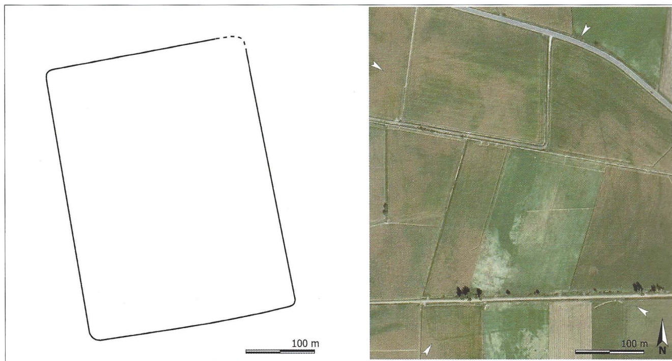
Fig. 3. Vista sobre ortofoto e interpretación de la planta.

mismo, el trazado de una carretera local ha afectado parcialmente al recinto en la esquina nororiental del campamento.