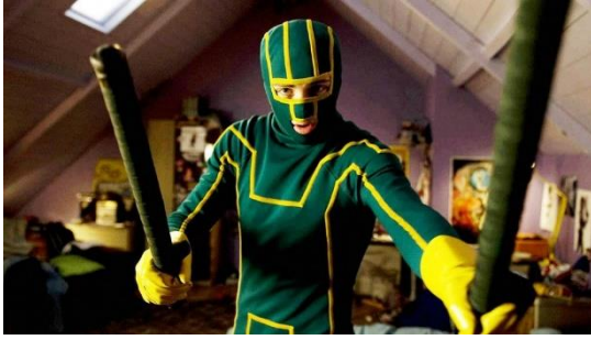
Figura 5. Kick-Ass .