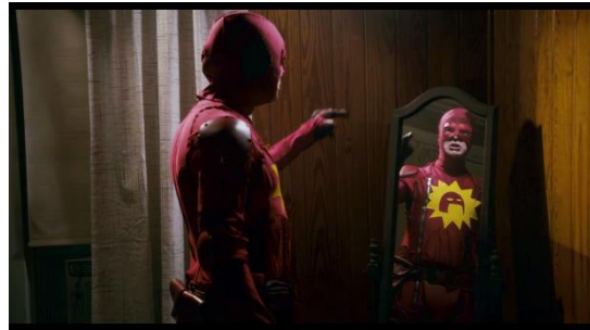
Figura 7. Defendor . Confección del traje.