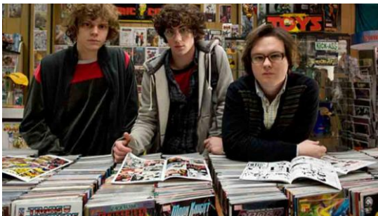
Figura 1. Defendor (Peter Stebbings, 2009)