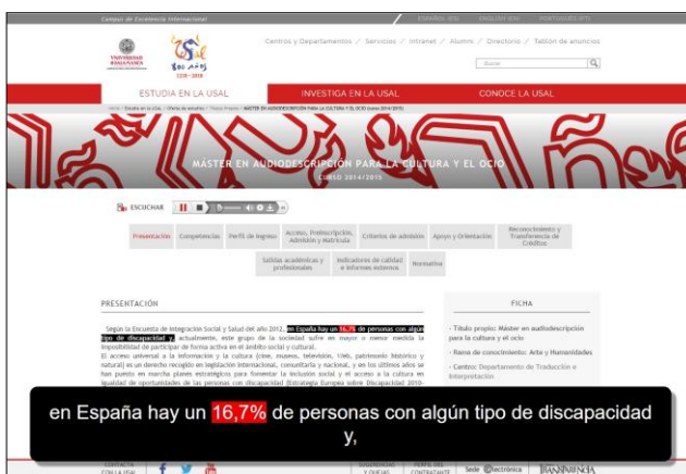
Figura 1. Presentación bimodal en página web de Universidad de Salamanca