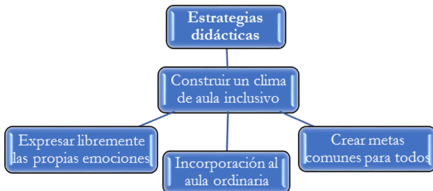
Figura 1: Objetivos socioeducativos expresados en estrategias didácticas

Los objetivos educativos se concretan en el proceso de enseñanza-aprendizaje a través de estrategias didácticas socioeducativas (Fig. 1).