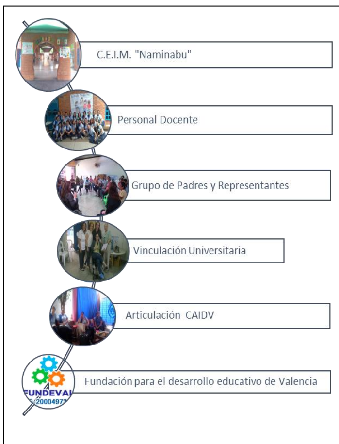
Figura 3. Evidencias fotográficas.

A continuación se muestran evidencias fotográficas de algunos de los diferentes ámbitos de la Comunidad de Colaboración que se dio y surgió en el C.E.I.M. “Naminabu”