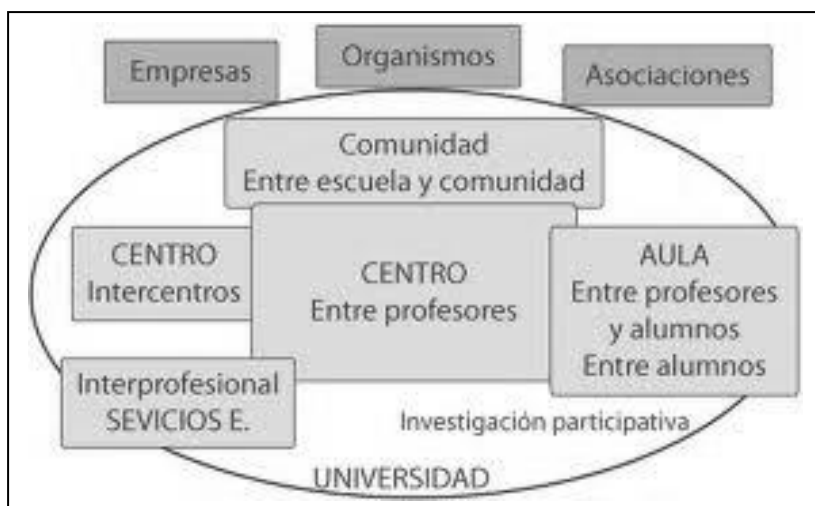
Figura 1. Ámbitos de Colaboración

Como se visualiza en el siguiente gráfico, en la parte central, se encuentra la escuela como protagonista del proyecto inclusivo, esta escuela a su vez debe establecer relaciones estratégicas con otros centros que gestionen también proyectos inclusivos, de manera que se puedan intercambiar experiencias, así como también entre las aulas que se encuentran en la institución, a través del trabajo cooperativo de los mismos. Así mismo se observan las conexiones entre el centro educativo, la comunidad con sus entes internos y externos, así como los servicios especiales de atención a los niños y niñas con alguna condición que los requiera (terapia de lenguaje, fisioterapia, psicología, entre otros) y la Universidad que a través de propuestas investigativas pueda comprender la diversidad en todas sus aristas y el proceso inclusivo.