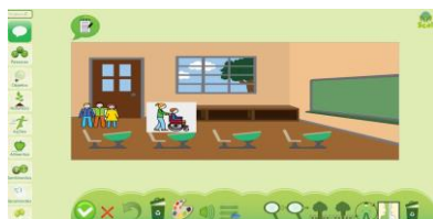
Figura 1: Módulo Narrativas Visuales: edición

El módulo Narrativas permite la creación de narrativas simples con uso de símbolos pictográficos sobre un escenario que tiene la posibilidad de modificar cada pictograma separadamente con expansión, rotación y combinación de pictogramas. Los escenarios son editables y los pictogramas pueden ser incluidos de una selección particular además del banco de pictograma existente (aproximadamente 5500 pictogramas). En el Módulo Narrativas existen diferentes posibilidades de modelos permitiendo construir libros digitales. Cada narrativa puede tener también un texto que será reproducido en audio, además de tener posibilidad de insertar diálogos entre os personajes. La forma de la exportación y de impresión le permite compartir las producciones en las redes sociales y también en formato PDF y JPG. En las descripciones de los módulos, además de las categorías de pictogramas disponibles (objetos de las personas, la naturaleza, la acción, la comida, los sentimientos y mis imágenes) existe otra categoría (diálogos) que permite la inserción de pequeños diálogos.