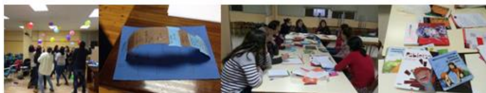
Imagen 3. Proceso formativo y de trabajo del Equipo de Profesores. 2016

Muchos materiales seleccionados y creados por el Equipo de Formación tienen relación con el plan de lectura de los centros, contemplándose la utilización de contenidos de obras seleccionadas de literatura infantil y juvenil. Considerando como evidencia basada en la práctica que no todos los docentes de la provincia de Soria pueden tener la misma facilidad y predisposición para trabajar las emociones en el aula, se pretendió facilitar su tarea difundiendo materiales ya creados que empleen libros de lectura, con los que cualquier profesor de aula pueda sentirse más cómodo o seguro, al disponer de una estructura o material de referencia para enfocar el diálogo sobre las emociones. El presupuesto de esta modalidad formativa ha permitido disponer de una ponente experta, pagar el desplazamiento a la sede formativa de los miembros que residen fuera de la capital y adquirir libros. El CFIE funciona así como centro de recursos compartidos para facilitar que cualquier docente de la provincia que revise nuestro trabajo y quiera replicarlo, pueda utilizarlos gratuitamente.