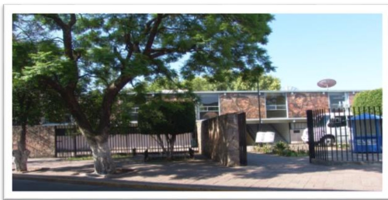
Figura 1. Benemérita y Centenaria Escuela Normal Urbana Federal “Profesor J. Jesús Romero Flores”, Morelia, Michoacán.