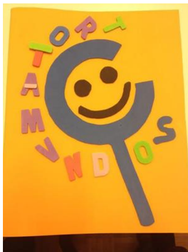
Figura 2. Ejemplo de Libro viajero "Trotamundos de chico de 1º ESO.

El libro viajero "Trotamundos" que se observa en la Figura 2 tiene la característica añadida de que se adapta a la etapa educativa de los alumnos enfermos.