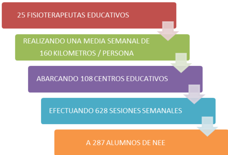
Figura 1. Nuestra intervención en cifras