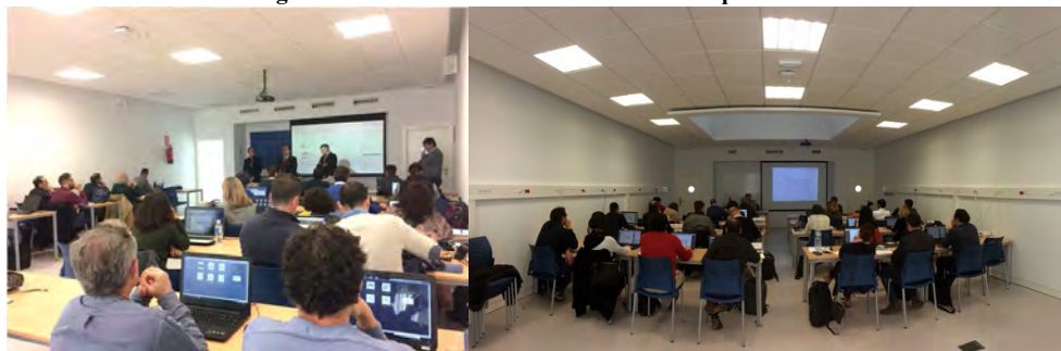
Figura 2 Docencia Aula Universitaria de Arquitectura

Hasta el momento, la media de asistentes por Curso se ha situado en 21 alumnos, con una punta de 36 y un valle de 10. Únicamente el curso AUA05.18 ha tenido que ser aplazado, actualmente se están analizando las causas. No obstante, la valoración media de los Cursos por parte de los alumnos se ha situado en un 8,3 de puntuación, con una punta de 8,6 y un valle de 7,8. Este dato, confirma tanto la calidad de los ponentes como los contenidos y adecuación a los objetivos de los programas impartidos.