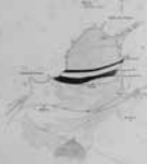
MAPA GEOLÓGICO DETALLADO DE LA REGIÓN COMPRENDIDA ENTRE LOS CERROS VIEJOS, PEÑAS Y TORRES.