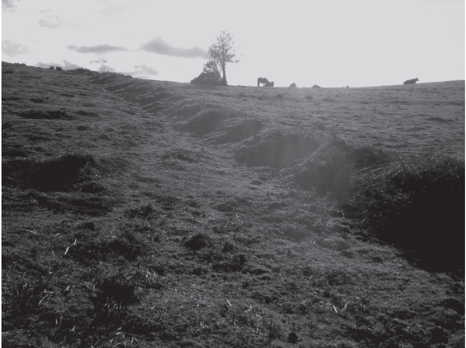
Trinchera y parapeto continuo que delimita el recinto conocido como El Bolero, en La Camperona.

continente orográfico, paraje destacado, y por ello imprescindible referente espacial, conocido como Col.laón de l'Arca . Algo más abajo y, probablemente como topónimo derivado de el del collado de referencia, se ubica el paraje conocido como Quentu'l Arca .