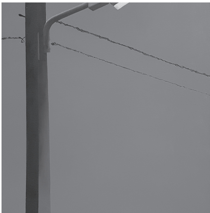
Celsa Díaz Alonso (Oviedo, 1965), Sin título , 2017