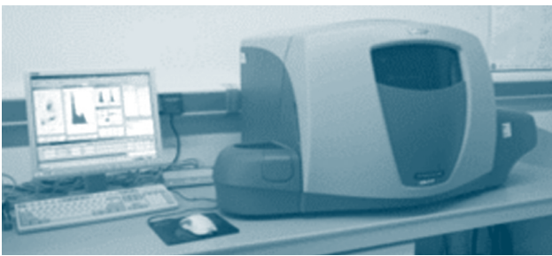
Figura 1. Equipo estándar de citometría de flujo

La citometría de flujo (en inglés “flow cytometry”, FCM) es un excelente método para analizar propiedades ópticas, tales como la fluorescencia y dispersión de la luz de partículas microscópicas en suspensión líquida. Las células son inyectadas en un flujo líquido laminar (el flujo laminar se caracteriza por la “no mezcla” de las líneas de flujo del sistema, es decir, al introducir un colorante éste fluye por el sistema como una línea más o menos estrecha sin mezclarse con el líquido circundante) y pasan una a una por un punto de medida iluminado con luz de alta intensidad (láser). Cada célula en el punto de interacción produce una señal fluorescente que es de intensidad proporcional a su contenido en fluorocromo. El impacto del rayo en cada partícula genera señales ópticas que, una vez recogidas por medio de detectores, son convertidas en señales o eventos electrónicos y posteriormente digitalizados y computarizados. La FCM es rápida y fiable, y por lo general la preparación de las muestras ocupa sólo unos pocos minutos y no requiere costosos reactivos. Se trata de un método “no destructivo” porque solamente se necesitan unos pocos miligramos de tejido, obteniendo una gran cantidad de núcleos que pueden ser medidos en poco tiempo (Fig. 1).