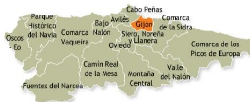
Ilustración 1. Comarcas de Asturias.

cafetería. Las actividades que se realizan en este centro son organizadas desde la oferta formativa del programa Aulas para Mayores, donde se realizan salidas culturales, excursiones, y la celebración del día del socio. La asociación de Pensionistas y Jubilados “El Descanso”, son los encargados de la gestión del programa, el cual es