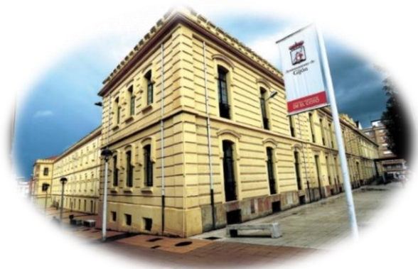
Ilustración 3. Centro Municipal Integrado del Coto

En las primeras etapas de esta iniciativa se buscó la utilización de las Nuevas Tecnologías de la Información y la Comunicación (TIC) y aprendizaje de idiomas. En 1996 se ponen en marcha Proyectos Piloto en Barcelona y Bilbao para comprobar el sistema de trabajo de estas escuelas y realizar una evaluación, la cual fue favorable. En 1999 aparece la Asociación Europea de ciudades de escuela de segunda oportunidad, desde la que se pretende apoyar este movimiento de creación de escuelas.