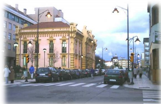
Ilustración 2. Centro de Mayores del Coto.

Cercano a este centro de mayores se encuentra el Centro Municipal Integrado del Coto, donde está ubicada la Escuela de Segunda Oportunidad de Gijón, la cual aparece a consecuencia del informe Delors (1996), donde se comenta y denuncia la situación de los jóvenes en exclusión social dentro de las ciudades o grandes núcleos urbanos.