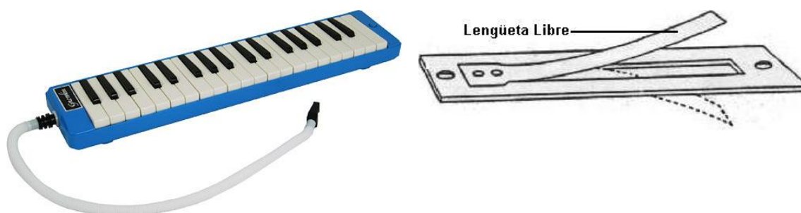
Figura 4. (De izquierda a derecha) Ilustración de una Melódica y del Funcionamiento de una Lengüeta Libre.

se mueven libremente en el aire por su elasticidad, produciendo una serie de oscilaciones generadoras de sonido –Véase Figura 4-. La particularidad de estas vibraciones es que son isócronas , es decir, se realizan siempre en igual número, por lo que se puede modificar la intensidad sonora sin alterar la altura de la nota, obteniendo un sonido afinado con menor esfuerzo y favoreciendo la improvisación por su sencillez. Asimismo, es posible lograr un rango dinámico de unos 49 dB, siendo posible interpretar una gran cantidad de matices dinámicos, aumentando la sensación de textura en la interpretación musical.