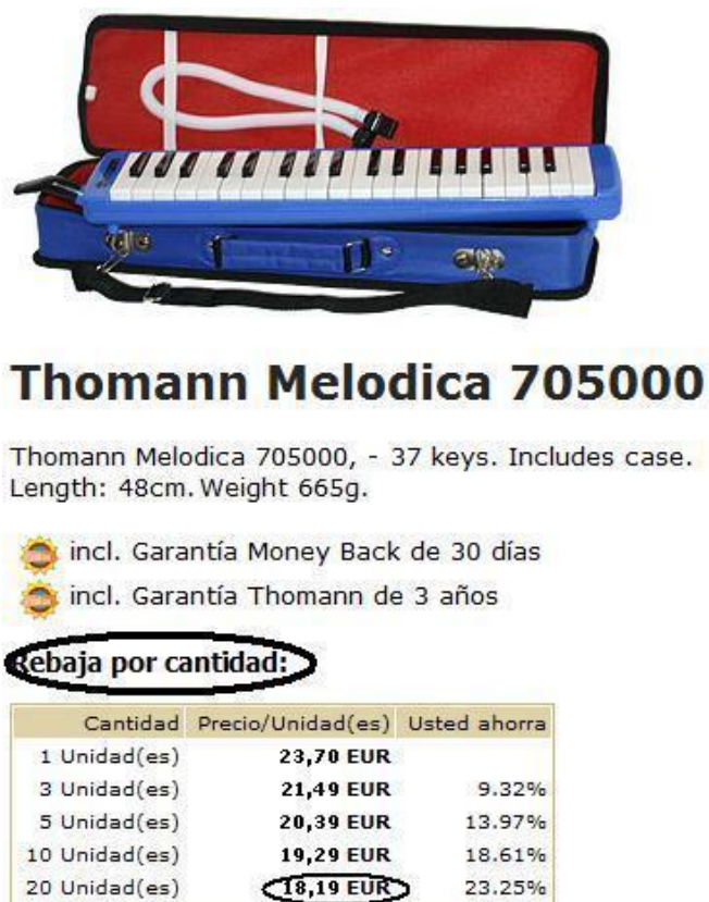
Figura 5. Extracto de la página http://www.thomann.de/es/gewa_melodica_705000.htm

El primer paso para la implantación de esta innovación es la adquisición de las Melódicas como recurso extraordinario en el aula. El precio individual de este instrumento oscila entre los 23€ y los 40€, aunque a mayor cantidad se produce un descuento por volumen de compra, llegándose a reducir a los 18€ obteniendo 20 productos –Véase Figura 5- en la tienda virtual de Thomann - http://www.thomann.de -.