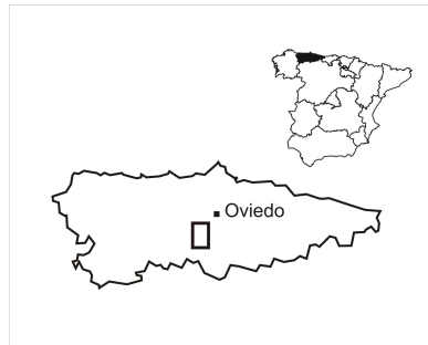
Fig. 1. Localización del área de estudio.