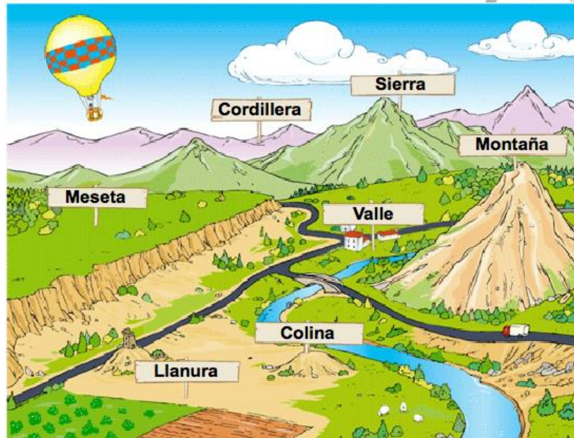
Figura 1: Estructura geológica del planeta Tierra