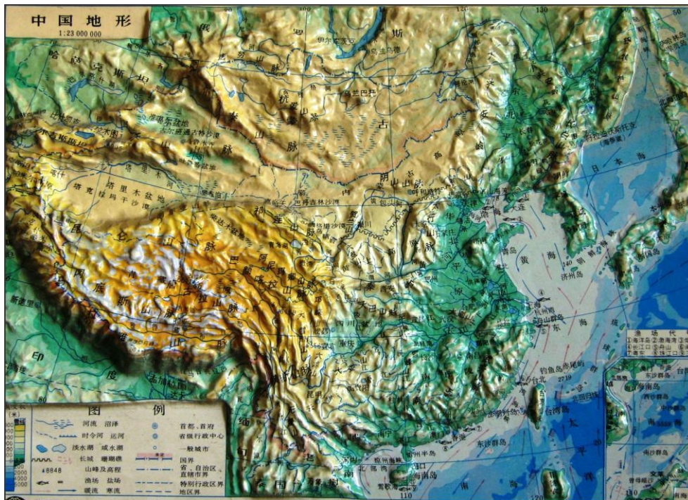
Figura 2: Estructura geológica de China

Fuente de la imagen: https://zhidao.baidu.com/question/1702507821354997340.html