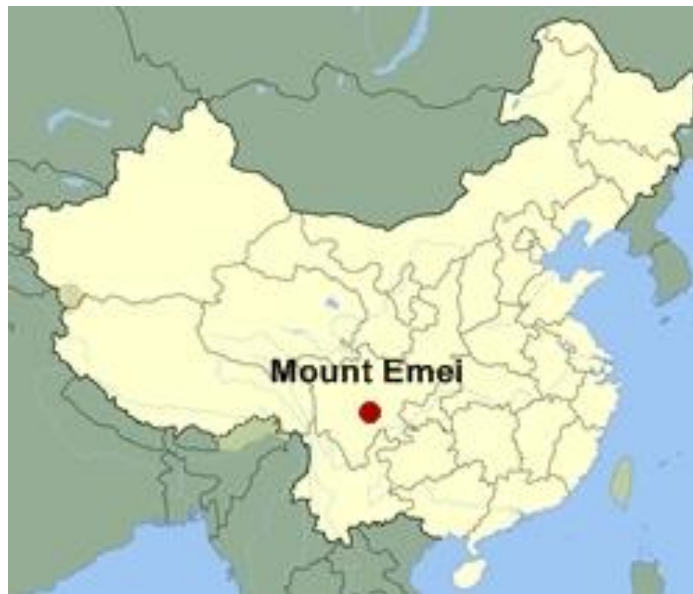
Figura 5: la montaña Emei