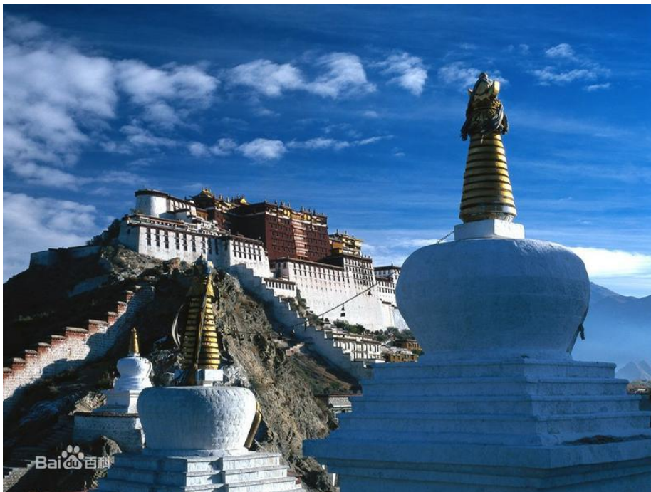
Figura 4: el Palacio Potala