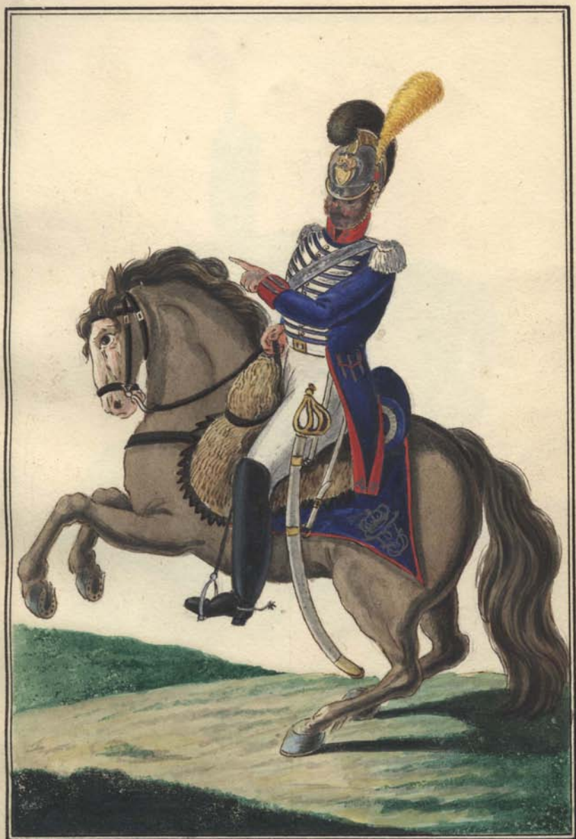
Caballeria & linea.