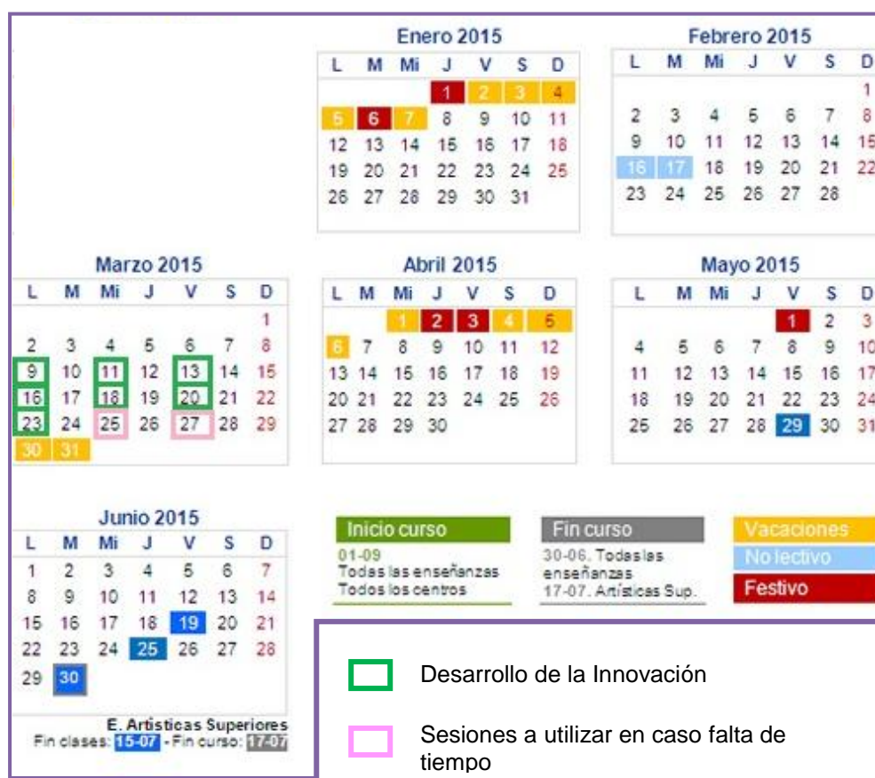
Figura 1: Calendario académico 2014-2015 de la Consejería de Educación. Segundo y tercer trimestre y fechas de desarrollo de la innovación