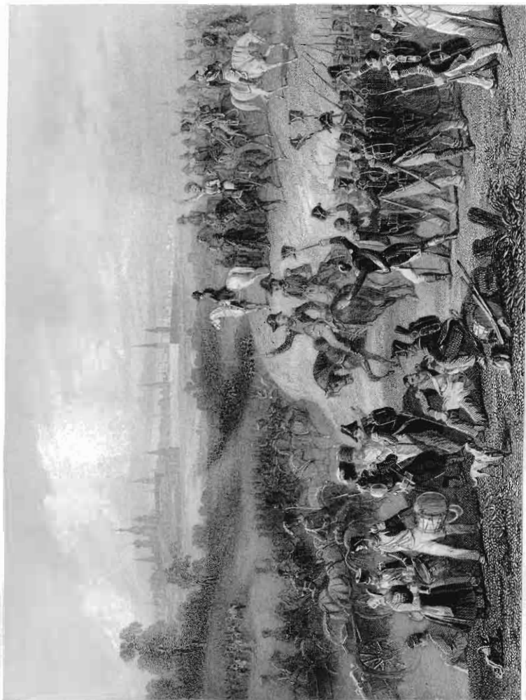
Jug. Charpentier del.