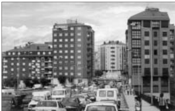
FIG. 5. Presión edificatoria sobre la avenida del Castillo.

ción interna y, en la medida en que revalorizan localmente el suelo, también modifican el mapa de precios despertando interés inmobiliario. La iniciativa de mayor alcance sirvió para completar los tramos preexistentes de la avenida del Castillo, verdadera ronda interior que discurre en arco por la parte sur del casco, desde el parque del Plantío hasta el parque del Temple y Flores del Sil (más de 2,5 km.). De esa forma conecta la parte alta (carretera de León) con el centro de la ciudad, el barrio de la Estación y la carretera de Orense, evitando la travesía del eje director tradicional (General Vives en el barrio alto y la avenida de La Puebla en el Ensanche), ya que supera el río Sil por el puente García Ojeda inmediatamente debajo de la fortaleza. Rebasado el curso fluvial la avenida del Castillo se bifurca en la plaza Luis del Olmo, principal nudo distribuidor; de allí deriva como ramal el nuevo bulevar de Pérez Colino, la otra gran obra de reforma interior, que da acceso a la plaza de Lazúrtegui. Esas operaciones sirven de estímulo para la renovación de enclaves degradados y desplazan la actividad edificatoria en dirección meridional; el resultado es un relleno de bloques que adquieren formación densa en el tramo alto de la avenida del Castillo, Luis del Olmo y Pérez Colino, donde se acumula el mayor plusvalor.