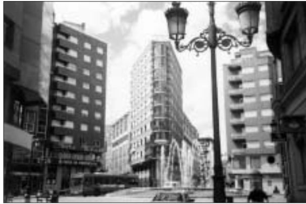
FIG. 6. Plaza de Lazúrtegui, Ensanche de La Puebla.

Ese proceso debe ser examinado desde otra perspectiva exterior al terreno de las apariencias. Como en la