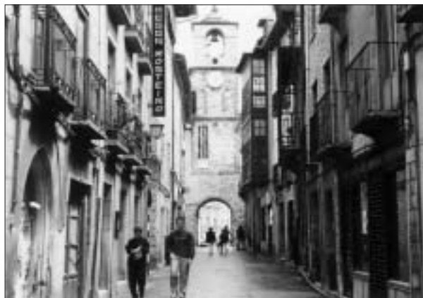
FIG. 7. Calle del Reloj, eje director del barrio alto.

La reconstrucción del tejido económico, aún muy incipiente, también encuentra su principal estímulo en el turismo, motivo por el cual la hostelería adquiere un casi total protagonismo, sin más contrapunto que el pequeño comercio tradicional. Han faltado medidas complementarias para el relanzamiento de los negocios, pues únicamente en el año 2000 cobra forma el proyecto para peatonalizar la parte central del casco (plaza de la Encina, calles Reloj, Gil y Carrasco y Flórez Ossorio), mas la calle del Rañadero donde se aplican rebajas impositivas con idea de formar una ruta de la artesanía. Con anterioridad fue inaugurado el estacionamiento subterráneo de la plaza Mayor, que presta apoyo indirecto al Plan de Dinamización Turística (2001) en cuanto al fomento de la hostelería especializada.