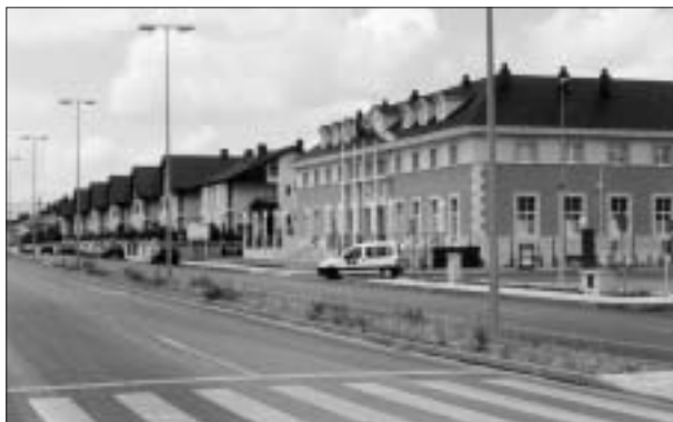
FIG. 3. Usos de baja intensidad en el parque La Herrería (PP-3).

forma parte de la lista indicativa realizada en el año 2000 por el Ministerio de Cultura para extraer las menciones de la UNESCO en el próximo decenio.