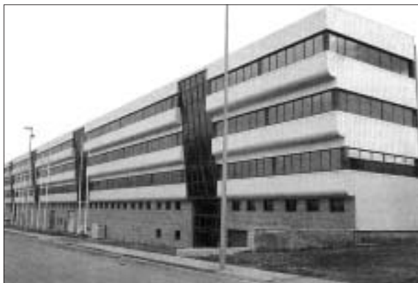
FIG. 2. Factoría de componentes eólicos COMONOR, en el polígono de Cabañas Raras.