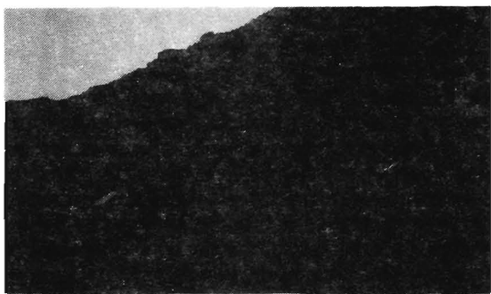
Fig. 1. Canales de aludes con restos de nieve en el respaldo del nicho nivo-cárstico.

Pero la relación de estas dos formas de excavación no se limita a la inscripción de las canales en el nicho, sino que muy probablemente ésta sea reflejo de otra, existente entre los respectivos procesos modeladores y que explica la pervivencia del nevero a una altitud que resulta excesivamente escasa (650 - 700 m. aprox.), incluso para las bajas temperaturas existentes en Asturias durante las fases frías del Cuaternario: que las canales desemboquen unos 50 ó 70 m. por encima del fondo del recueno indica que era a esa altura a la que se encontraba la superficie del nevero en él albergado, sobrealimentado por los aludes y causante no sólo del retoque del nicho cárstico preexistente, sino también de un arco de morrena de nevero que presenta las características peculiares de este tipo de depósitos, observables en la figura 2 (perfil muy disimétrico, sin apenas pendiente del lado de la nieve, pero con una caída rápida por la cara opuesta, predominio de grandes bloques, etc.). De la situación hipotética de la cabecera y del frente del nevero, que coincidirían respectivamente con la desembocadura de las canales y con la morrena, se infiere una inclinación media en su superficie de unos 45°, suficiente para asegurar la evacuación y acumulación a su pie de los derrubios caídos, bien desde las canales o bien directamente desde las pendientes rocosas que dominan el nicho.