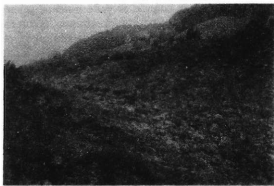
Fig. 3. Vista parcial de la colada septentrional, que en primer término aparece surcada por el vallejo que excavaron las aguas de una resurgencia cárstica. Al fondo, relieve alomado sobre las pizarras carboníferas.

Estas consideraciones hacen suponer que la formación del arco de morrena y la de las coladas pedregosas es prácticamente sincrónica o, al menos, está muy poco separada en el tiempo. Viene a confirmar tal supuesto un último argumento: el arco de morrena se encuentra abierto por sus dos extremos, de modo que no dibuja una convexidad dirigida hacia la parte baja de la vertiente, sino que apunta ligeramente hacia arriba, lo cual indica un derrubiamiento de sus extremos, en relación con un descenso máximo de la nieve por las márgenes del ventisquero; en efecto, es en los extremos del nicho donde las canales de aludes tienen una mayor envergadura y donde, por añadidura, no existe ningún tipo de resalte rocoso subyacente, que sí aflora localmente, al