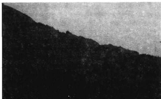
Fig. 2. Vista lateral del nicho, surcado a la izquierda por las canales de aludes y que presenta a su pie (derecha) la morrena de nevero. Entre aquéllas y ésta, depósitos de ladera recientes.